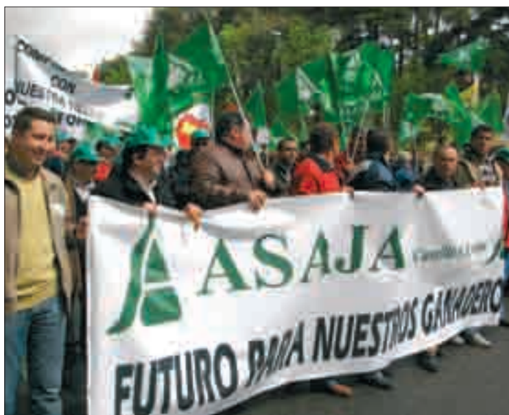
ASAJA reclama apoyo especial para los profesionales.

ASAJA de Castilla y León cree que está fuera de toda duda el cumplimiento de los tres únicos requisitos que establece la Comisión para poner en marcha estos apoyos: que sea ayuda necesaria, apropiada y proporcionada. En este momento de crisis del sector primario que se viene arrastrando durante dos campañas y que no tiene visos de solucionarse, el Estado y