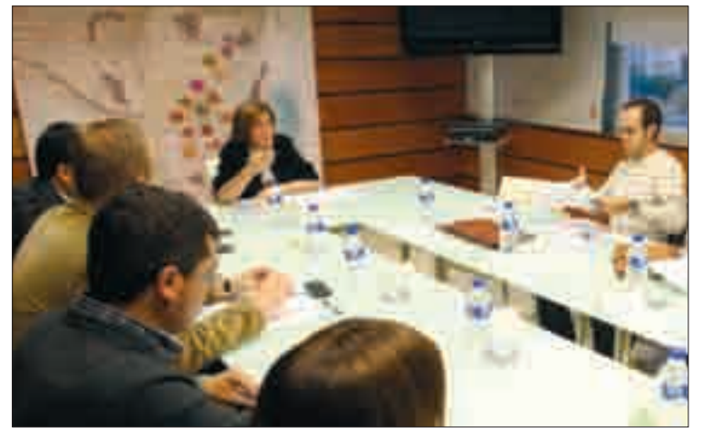
La última Mesa de la Patata de Castilla y León.

En el año 2007 se editó ya una guía similar a la presente, pero sólo estaba traducida al rumano. El manual de este año suma a este idio-