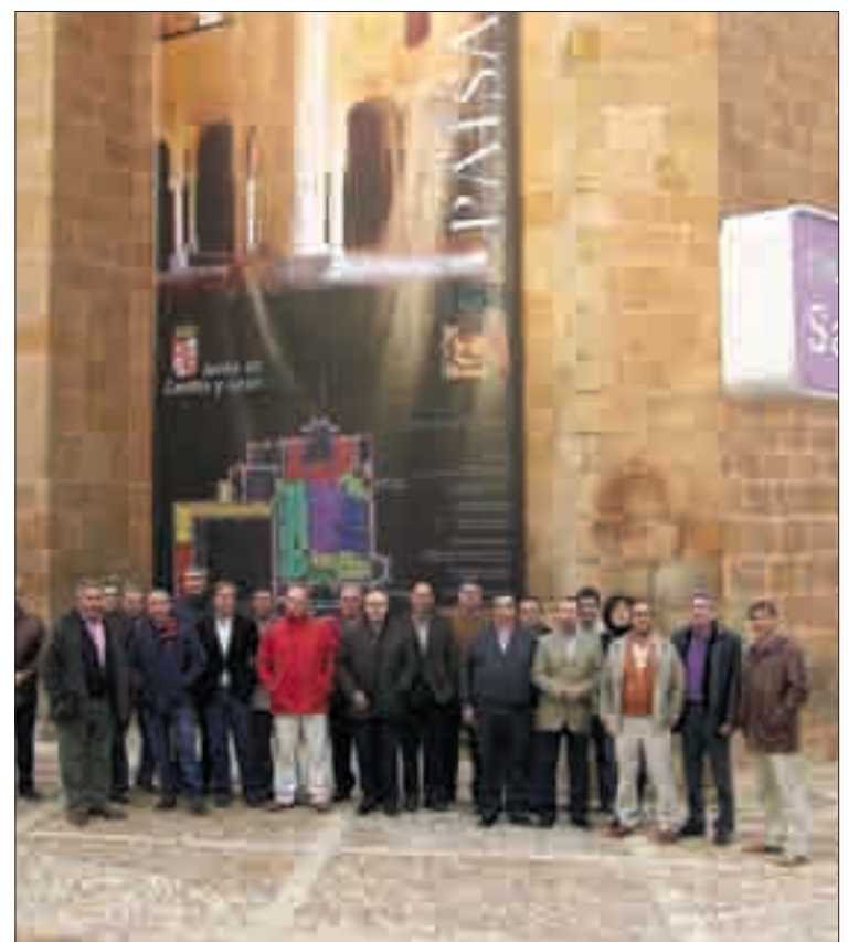
La junta directiva de ASAJA CyL visitó en Soria la exposición Las Edades del Hombre .

Los presidentes provinciales de ASAJA en Castilla y León ultimaron en Soria las movilizaciones que llevará a cabo esta organización agraria para protestar por la situación de crisis que arrastra el sector primario.