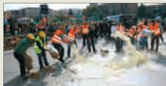
Los leoneses tiraron leche y otros productos.

5. Un programa nacional y europeo de “rescate” al