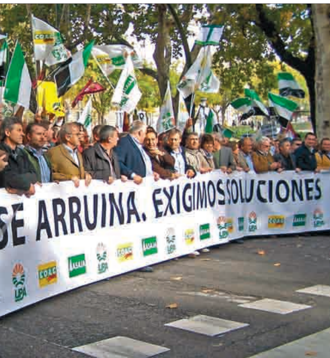
La pancarta de cabecera, en la que se unieron opas, cooperativas, regantes, etc. en defensa del campo.