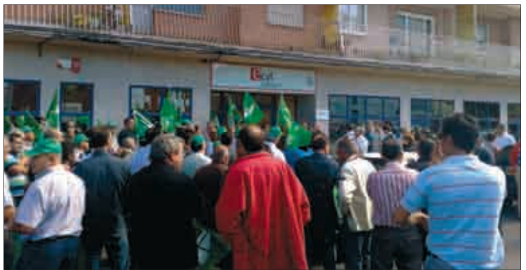
Las movilizaciones son continuas en un momento clave para el futuro del sector.