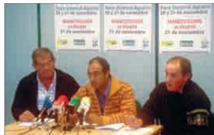
Una de las charlas dadas por el presidente provincial.

El grave problema de rentabilidad de nuestras explotaciones, en las que los costes de producción superan con amplio margen los ingresos que percibimos por la venta de nuestros productos, ha pro-