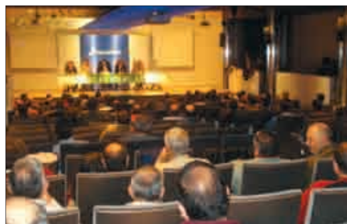
La Asamblea se reunirá el próximo 29 de enero.

Podrán ser electores todos los socios de ASAJA-Burgos y pueden ser elegibles todas las candidaturas formadas por socios que se