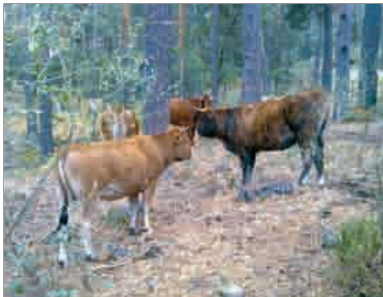
La vacunación será obligatoria en 27 municipios de la provincia.

Si bien hasta hace poco el director general había sido reticente en decidir poner en práctica este plan especial en una parte de la provincia hasta que no obtuviera nuevos resultados, el reciente mapa de Especial Incidencia surgido de los resultados de la última vuelta de saneamiento le ha obligado a tomar la decisión de definir un "Programa sanitario específico" para la zona de especial incidencia de brucelosis en Segovia con vacunación obligatoria en veintisiete municipios del sur y sur-este de la provincia de Segovia. Municipios todos ellos donde más proliferan las explotaciones de vacuno extensivo, y que en los últimos años la prevalencia de esta enfermedad iba en aumento, demostrándose que sólo con los planes de detección y sacrificios a positivos no se atajaba el problema sino al contrario.