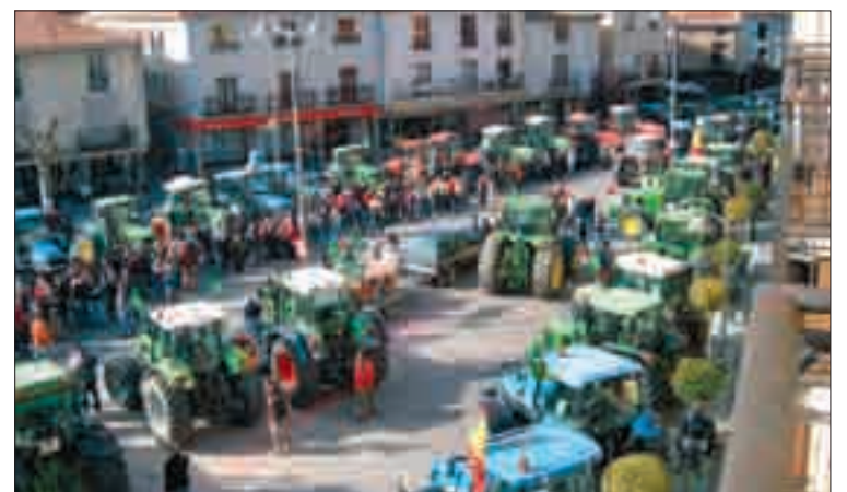
La tractorada celebrada en Arévalo el día 20.