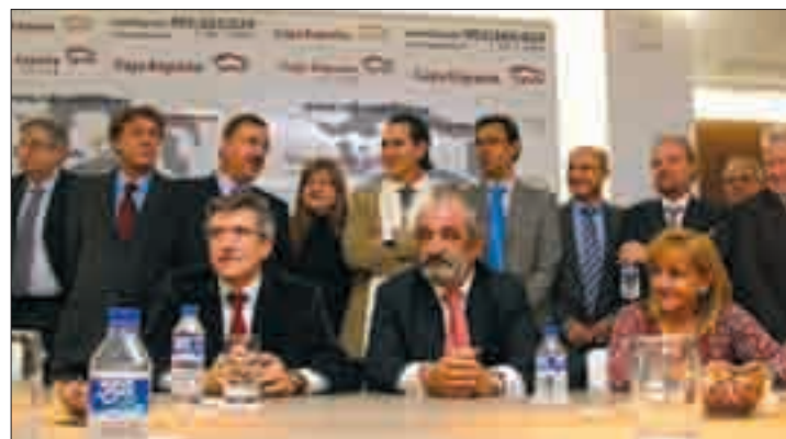
El Consejo de Administración de Caja Duero (arriba) y de Caja España.