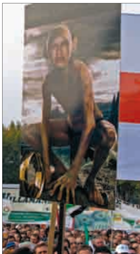
Espinosa no salió demasiado favorecida.

tación de Madrid sirvió para sumar las voces de miles de españoles que piden futuro para el campo, en un país en el que “sería una irresponsabilidad histórica abandonar a su suerte un sector productivo puntero y dinámico, que además está vertebrando nuestro territorio. La agricultura y la ganadería