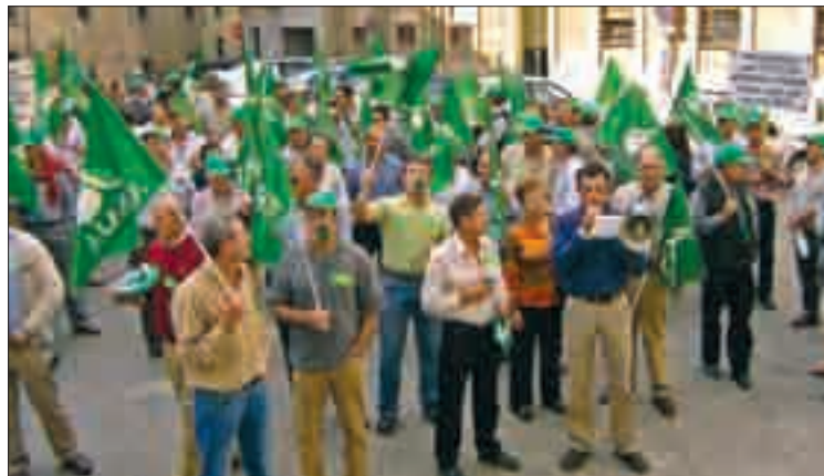
Los manifestantes recorrieron la capital.

Además se reclamaban precios justos para nuestros pro-