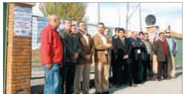
ACOR cerró la recepción durante los dos días.