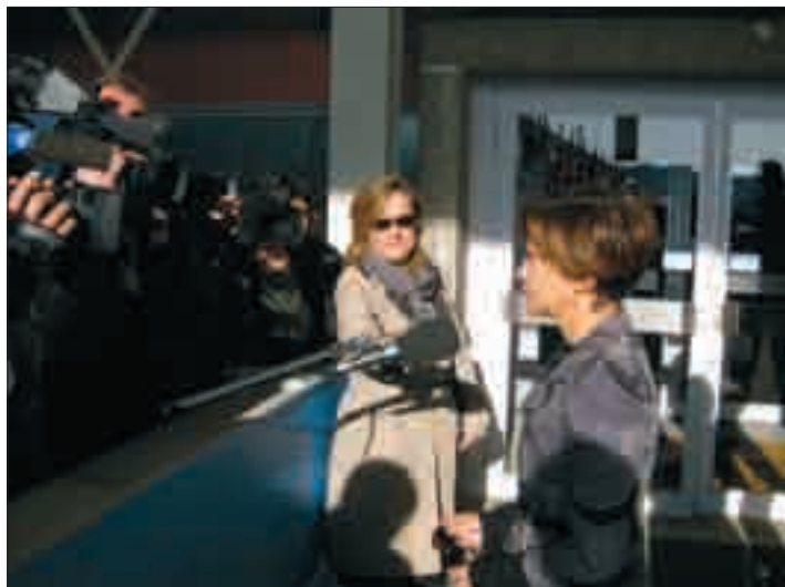
Declaraciones de Elena Espinosa tras el consejo de ministros.

Teniendo en cuenta los cálculos de la propia comisión los ganaderos de leche europeos recibirán de media 1.000 euros en concepto de ayuda adicional. Sin embargo, según calcula ASAJA esta ayuda queda reducida a la mitad en el caso de los ganaderos españoles. Con 12 millones de euros y un censo actual de 24.000 explotaciones de ganado de leche que tiene España, nuestros ganaderos percibirán justo la mitad que otro ganadero europeo, es decir unos 500 euros por explotación. Una ayuda de todo punto insuficiente cuando la rentabilidad de las explota-