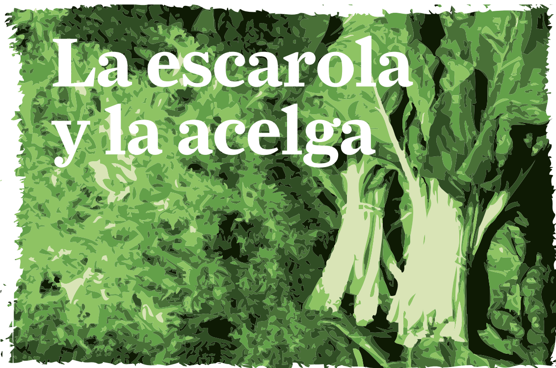
Serie histórica de superficie, rendimiento, producción y precio para la escarola.

b) Abonado. Se puede contar con una estercoladura, con lo que las cantidades de nitrógeno a complementar serán sensiblemente menores. El ni-