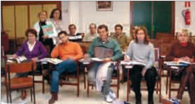
Los alumnos, junto a la profesora (izda, de pie), durante una de las clases de inglés.