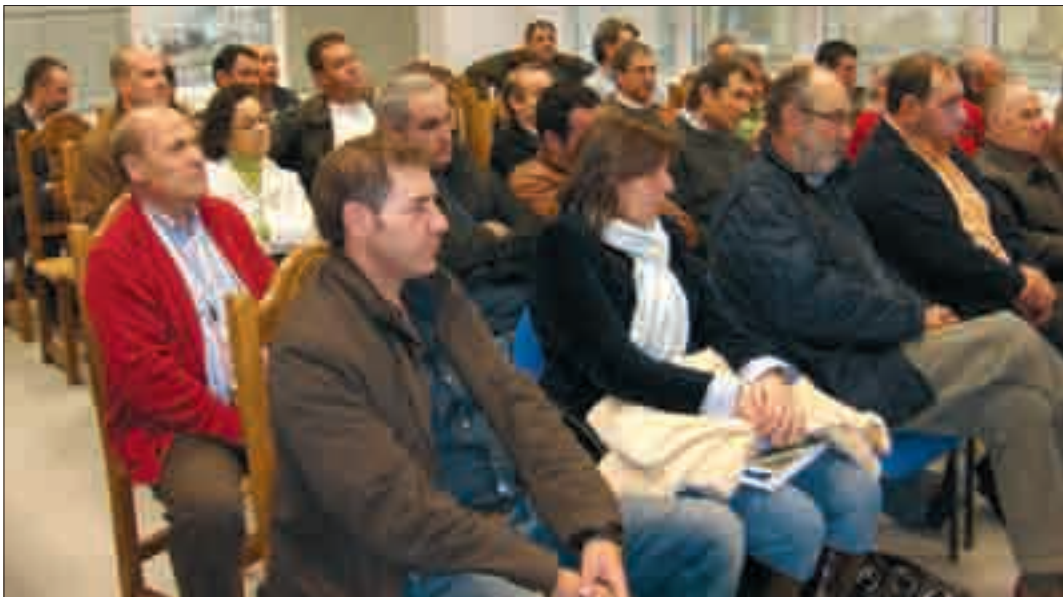
Asistentes a la última Junta Directiva de ASAJA-Palencia.