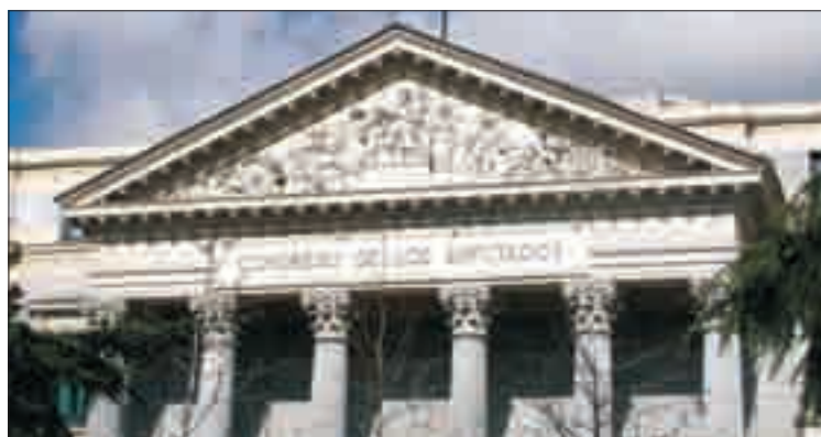
Frontón del Congreso de los Diputados.

Los Presupuestos del Gobierno para 2010, prevén en su artículo 79 que el IVA compensatorio del Régimen Especial