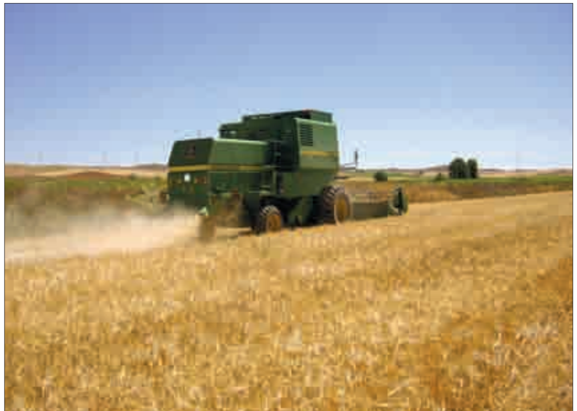
La cosecha se está convirtiendo en actividad de altísimo riesgo económico.

Desde la OPA se puede asumir que algunos incendios se lleguen a causar por negligencia de agricultores o ganaderos; algo de todas formas muy remoto porque los profesionales saben perfectamente lo que están haciendo y conocen el terreno como nadie porque son los que cuidan del campo todo el año y los primeros interesados en su protección y mejora. Con la "alta rentabilidad" de las