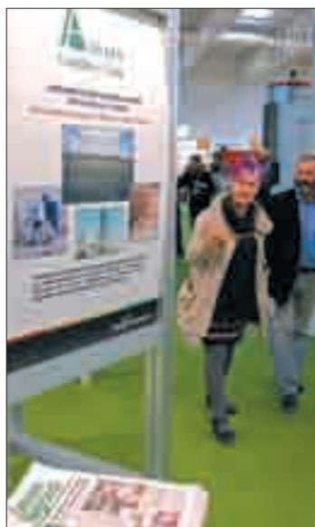
Nuestro stand en Expobioenergía.

Castilla y León apoya como socio colaborador, recibió 10.650 visitantes, todos profesionales. Los expositores de Expobioenergía'09 expresaron su satisfacción por la presencia en la feria de visitantes "con un elevado perfil profesional" que llegaban a los stand "sabiendo lo que buscaban". El balance en cifras de Expobioenergía'09 podría resumirse de la siguiente manera: Casi 400 empresas y marcas representadas procedentes de 21 países y 10.650 visitantes profesionales de 33 nacionalidades diferentes. En lo referido a visitantes, por sectores de actividad, es significativo el aumento en el ámbito de los instaladores. El director de Expobioenergía, Jorge Herro interpreta todos estos datos en clave de éxito: "La profesionalización de la feria ya es un hecho. Para los expositores surgen posibilidades de desarrollar nuevos proyectos e interesantes oportunidades de negocio, que es, en definitiva, el objetivo último que mueve a los organizadores de la feria: la dinamización del sector de la bioenergía". La próxima edición será los días 27, 28 y 29 de octubre de 2010.