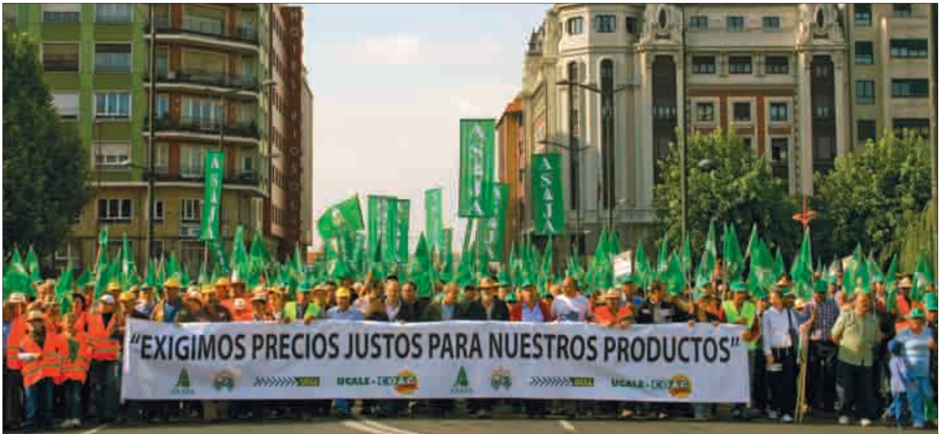
Respaldo masivo a la movilización conjunta del campo leonés, que recorrió las calles de la capital en protesta por la crisis de la agricultura y la ganadería.