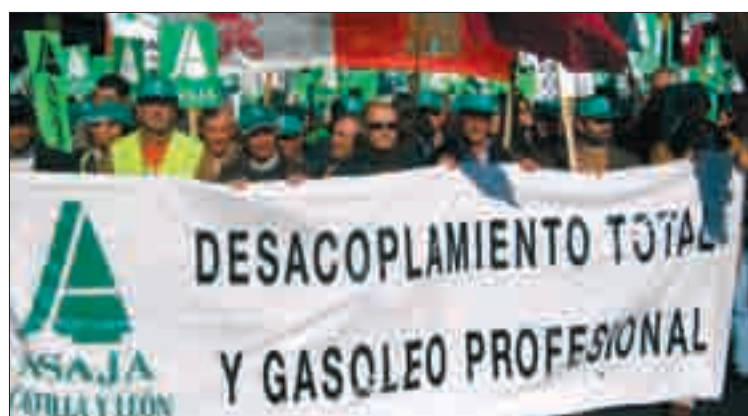
El tema del gasóleo profesional sigue sin resolverse.

ficiarios estaban, hasta ahora, obligados a tributar por ellas. Con esta medida, se atiende la reivindicación de ASAJA en este sentido.