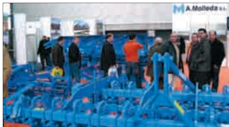
Comprar maquinaria en estos tiempos es casi inaccesible.

estaba invirtiendo en el sector, pero son ahora los datos oficiales los que corroboran la voz de alarma dada por la principal organización agraria de Castilla y León.