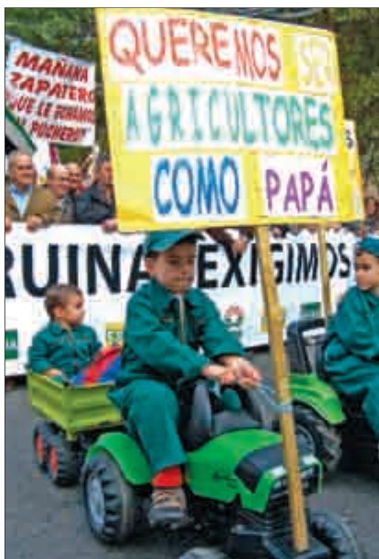
Los niños se hicieron un hueco para apoyar la marcha.

VIDAL MATÉ, PUBLICADO EN VARIOS PERIÓDICOS PROVINCIALES.