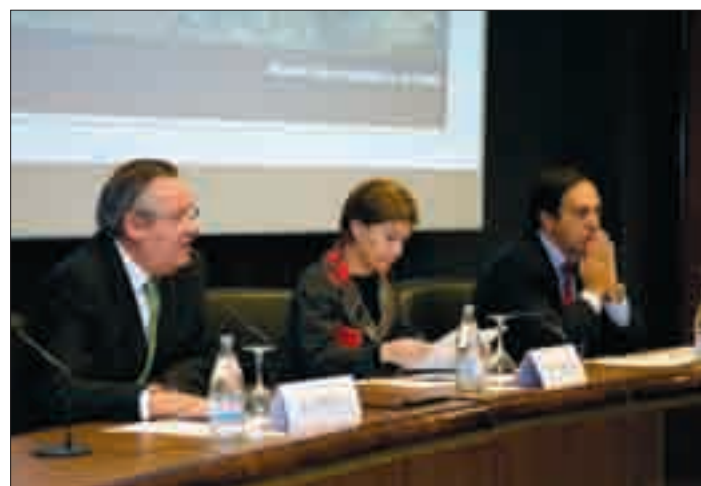
Los presidentes de ASAJA y de MAPFRE, con la ministra Espinosa.

En la primera parte de este seminario participaron, entre otros, miembros de la Risk Management Agency, organismo dependiente del Gobierno Federal estadounidense que ayuda a los empresarios agrícolas a buscar soluciones a sus riesgos, y la Financière Agricole de Québec, entidad canadiense creada para proteger los ingresos de las empresas agropecuarias de la región y gestionar herramientas de financiación destinadas al sector.