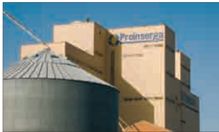
Los agricultores son los grandes olvidados de esta crisis.

La deuda total que mantiene con Campo Segoviano supera los 3,8 millones de euros (por encima de 600 millones de pesetas) por la venta de su grano. Los agricultores saben que no podrán cobrar el monto total de la deuda pero es absolutamente urgente que puedan saber cuánto y cuándo cobrarán. En la actual situación de crisis y carencia de financiación los agricultores de la provincia han acabado ya con las reservas que un día pudieron mantener. Ahora afrontan los pagos de los medios de producción de la nueva cosecha sin disponibilidad alguna. El desproporcionado incremento de los precios de los fertilizantes, los fitosanitarios y la energía, frente a la