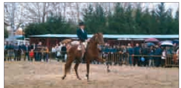
La Feria del Caballo, que se celebra paralelamente.

público que acudió a Fuentepelayo ha sido muy variado, desde agricultores y ganaderos que fueron a conocer las últimas novedades de sus respectivos campos, hasta hombres, mujeres, jóvenes, adultos, jubilados y niños que se pasaron también por Fuentepelayo.