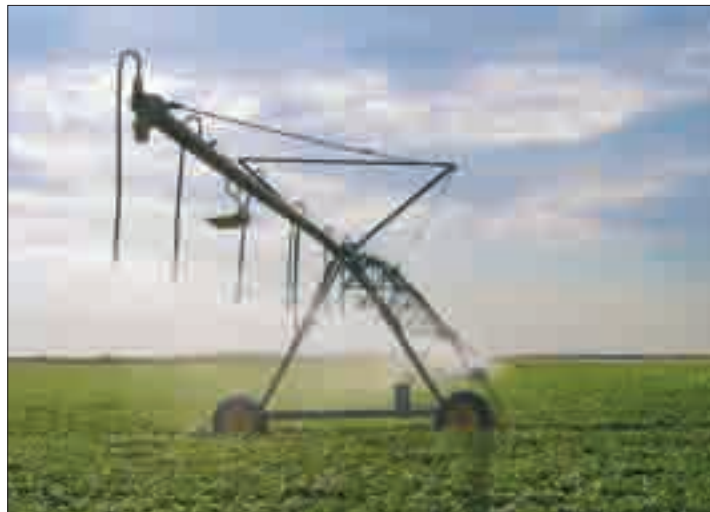
El regadío, fundamental para la agricultura de la zona.