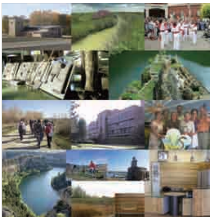
El proyecto se ha desarrollado en cuatro casas del parque.

Más específicamente, el Proyecto Intergeneracional de educación ambiental y voluntariado senior ha buscado modificar hábitos que repercutan favorablemente en el medio natural, creando espacios de reflexión acerca de la ecología humana y la construcción social.