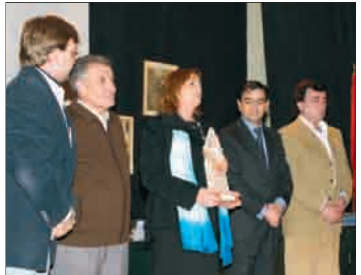
La presidenta de AMFAR, recibiendo el galardón.