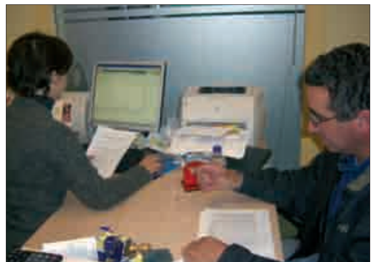
Cada año son más los agricultores que confían su PAC en ASAJA-Soria.

de confiar la tramitación de su PAC en técnicos especializados de su propia organización. También agradece las nuevas incorporaciones de profesionales del campo (que podrían llegar a ser un 10 por ciento más que en la campaña anterior) que se han decantado por ASAJA para gestionar su PAC y que hacen seguramente de esta OPA la segunda entidad en volumen