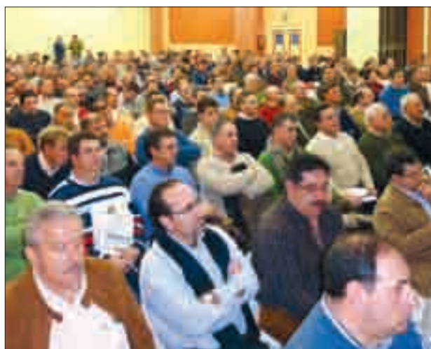
Varias imágenes de la jornada sobre remolacha, que contó con una gran asistencia, así como con la presencia de la viceconsejera de Agricultura.