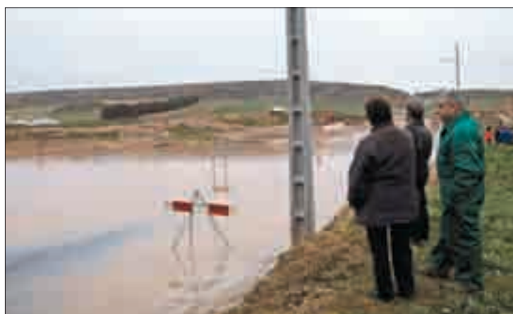
Las inundaciones han sido continuas estos meses.

El agua ha inundado las parcelas de numerosas explotaciones agrícolas, afectando sobre todo al maíz. Aunque aún es prematura su evaluación de daños, en algunos municipios queda casi la mitad de la cosecha por recoger. La remolacha, buena parte todavía por arrancar, se da prácticamente por perdida, y otras fincas donde están sembra-