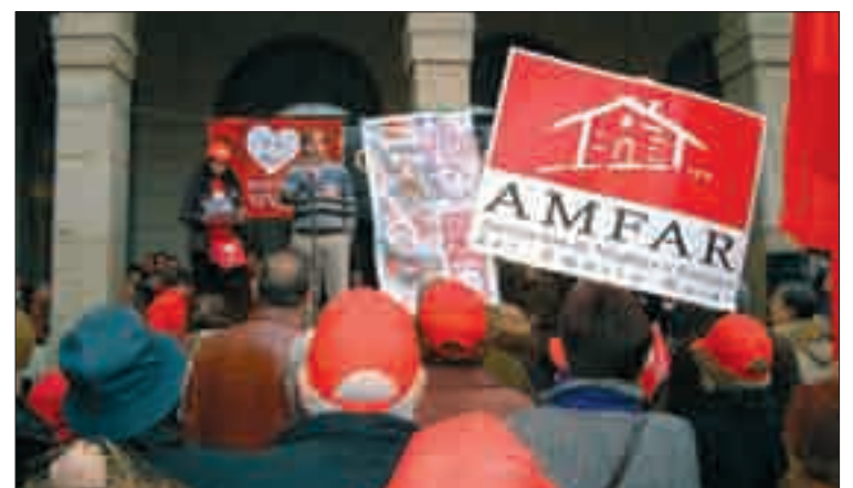
Concentración a favor de la vida, realizada en Ávila.