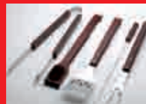
Set de barbacoa

Infórmese ya en su oficina Santander o en Superlínea 902 24 24 24