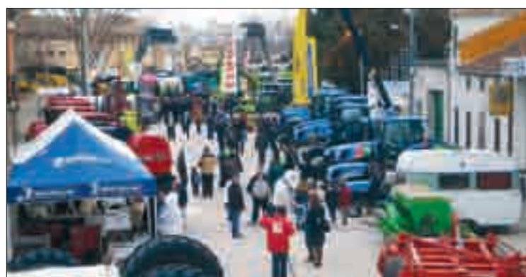
Una imagen de la Feria.

En los más de 20.000 metros cuadrados de exposición, pudieron verse los últimos modelos de tractores (con todas las comodidades para el agricultor como pantalla de ordenador, navegadores o bluetooth) además de una amplia muestra de cosechadoras, tractores-astilladoras, arados, abonadoras, em-