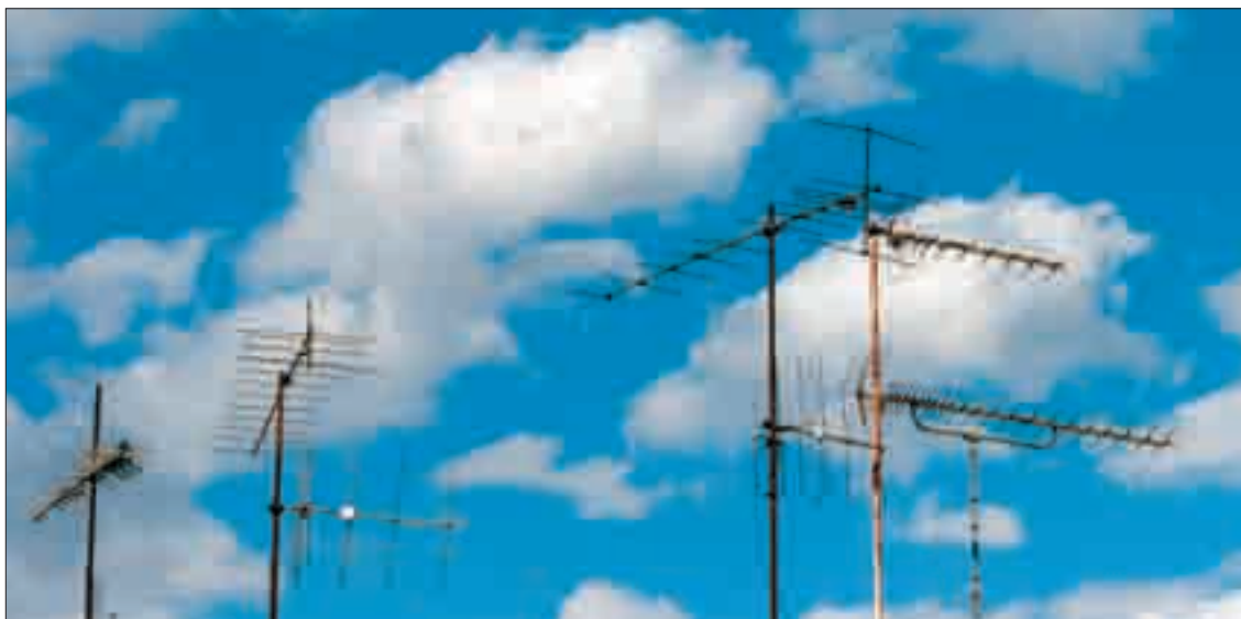
Una vez más las dificultades se multiplican para los vecinos de pueblos pequeños.