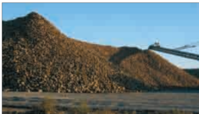
Recepciones a 14 de marzo de 2010

Sólo la fábrica de Olmedo recibió la remolacha de un tirón y puso el cierre definitivo a primeros de enero. Actualmente están las tres fábricas de Ebro cerradas temporalmente. Miranda intentará reabrir la recepción el 16 de marzo y está previsto que dure unas dos semanas. En Toro, esa misma semana habrá reunión y la apertura se fijará en función del tiempo y cuando esté arrancado el 65-70 por ciento de lo pendiente, todavía no se baraja fecha fija. La Bañeza también se reúne estos días para analizar lo mismo, pero la apertura será inmediata en cuanto el tiempo permita los arranques pues la mayoría de la remolacha se encuentra en malas condiciones y no aguantaría ni el almacenamiento ni el incremento de temperaturas.