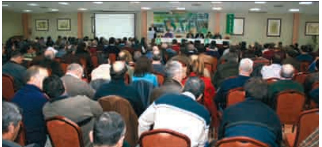
Asamblea de ASAJA-León, celebrada el pasado 7 de marzo.