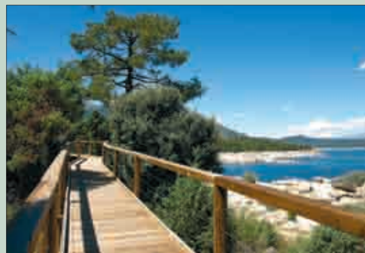
La senda es accesible para personas con dificultades.

Este proyecto se enmarca dentro del convenio entre la Obra Social "la Caixa" y la Fundación Patrimonio Natural de Castilla y León con un doble objetivo: conservar y mejorar los espacios naturales, a la vez que favorece la inserción de colectivos en riesgo de exclusión social. Hasta el momento se han insertado en la Comunidad Autónoma un total de 200 personas en situación desfavorecida y se