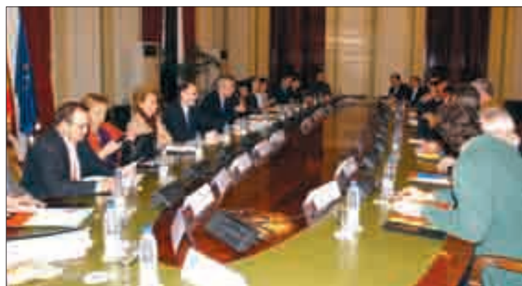
En las negociaciones se consiguen pequeñas cosas, a cuentagotas.

desarrollando la negociación con el Gobierno de José Luis Rodríguez Zapatero, "arrancando pequeños logros con cuentagotas, pero sin que se afronte de verdad un plan de choque".