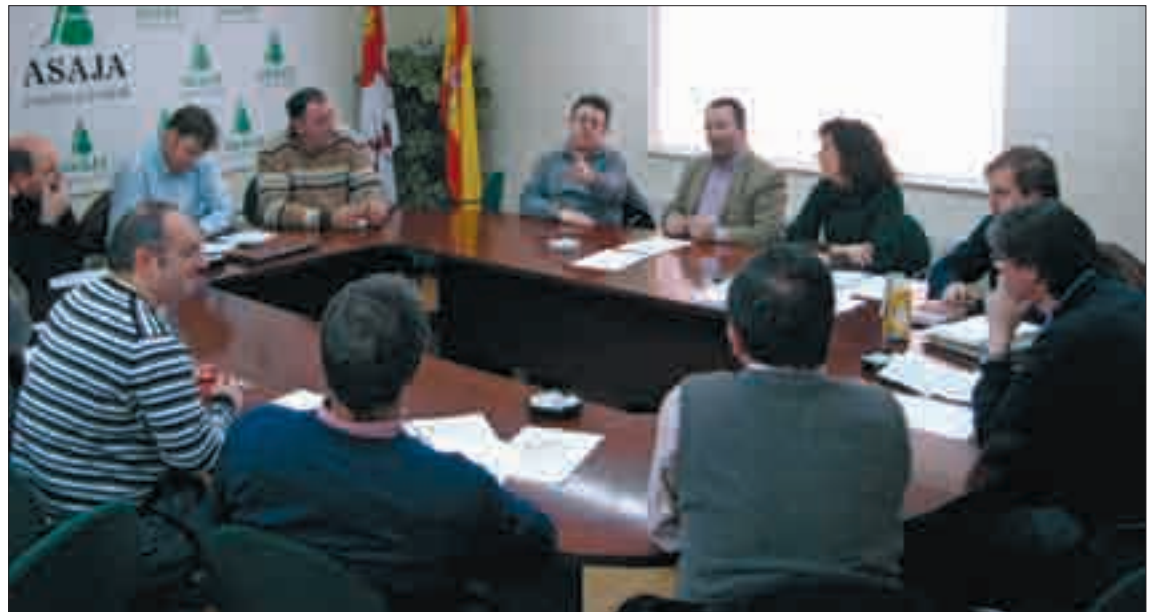
Última Sectorial Remolachera de ASAJA Castilla y León.

Podrán contratar este tipo de remolacha, hasta el límite máximo de sus derechos, aquellos agricultores que cumplen los requisitos establecidos en el Protocolo Interprofesional de Integración del AMI y del Plan 2.014 y se han acogido a la exportación de la remolacha "Adicional" de la campaña 09/10. El pago de esta remolacha se efectuará por parte de AE en las