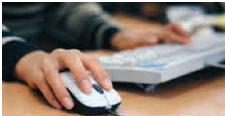
La informática permiten nuevos sistemas de formación.

ASAJA-Valladolid ha puesto en marcha dos nuevos cursos gratuitos sobre dos materias de gran interés para el profesional del campo del siglo XXI: la Prevención de Riesgos Laborales para la Agricultura y la Contabilidad Agraria. Ambos son on-line, es decir, no presenciales, puesto que se utilizarán técnicas informáticas.