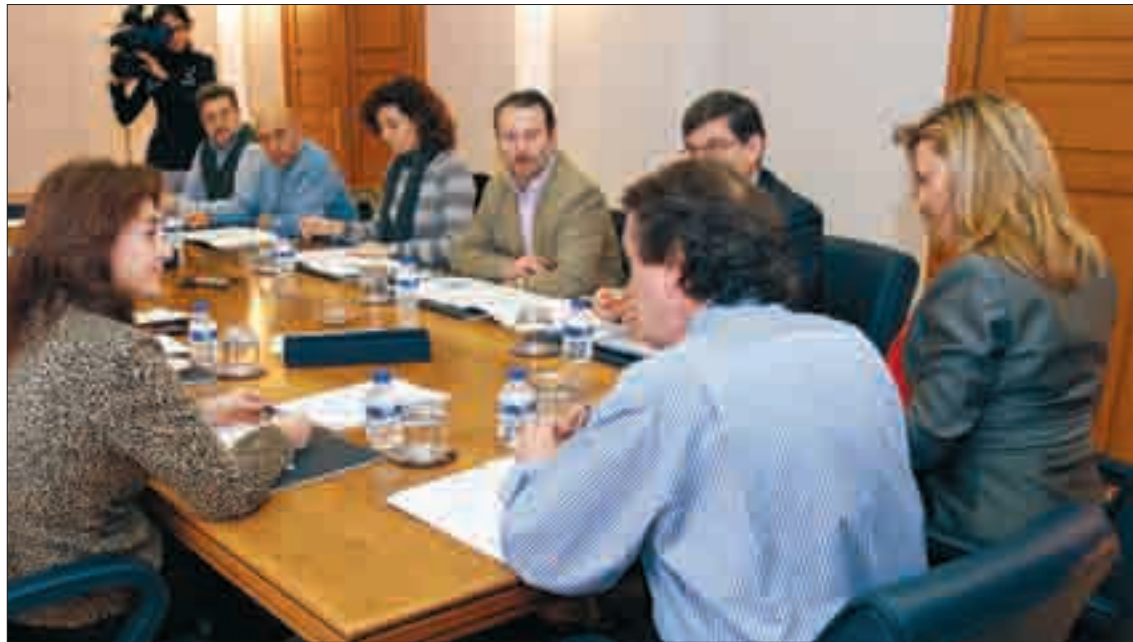
Un momento del encuentro de los consejeros de Presidencia y Hacienda con las OPAS, para analizar la Agenda de Población.

• Ayudar de forma específica a las empresas agrarias que