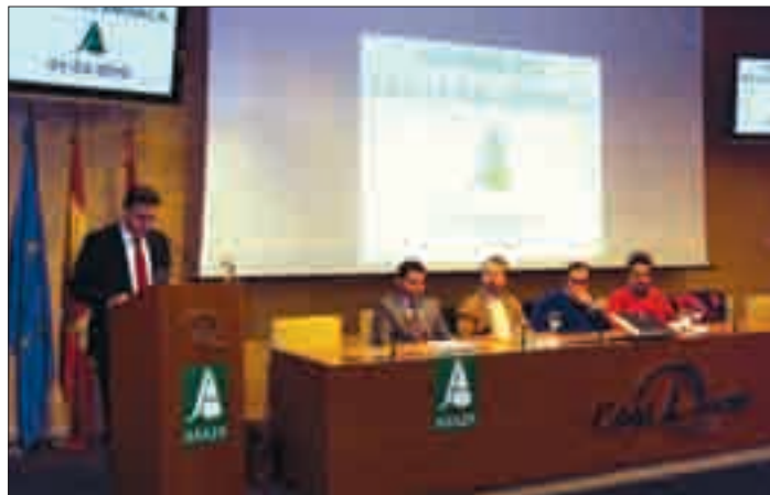
El acto fue en el salón de Caja Duero en la capital.