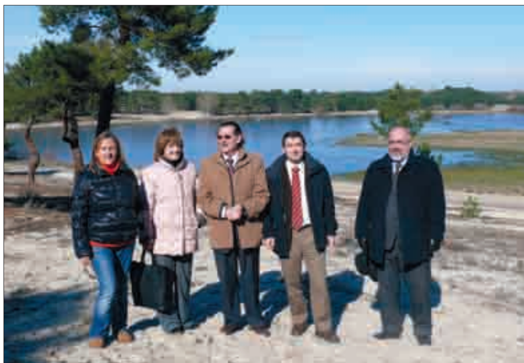
Visita de las autoridades a las lagunas de Cantalejo, recientemente restauradas.

Dentro del proyecto de restauración se han realizado distintas actuaciones encaminadas a ordenar el uso público del espacio, en especial en el entorno de las lagunas del término municipal de Cantalejo, que constituyen el enclave más atractivo para el visitante. Concretamente se han construido tres zonas de aparcamiento desde las que parten senderos bien compactados que facilitan el tránsito por los arenales del entorno. Estas sendas conducen a las principales lagunas, en cuyas inmediaciones se han levantado tres observatorios (Sotillos, Navalayegua y Navahornos) dispuestos a una distancia prudencial de la lámina de