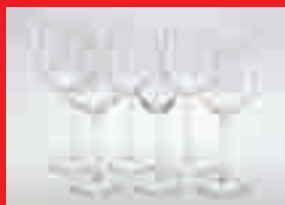
Cristalería de 18 piezas