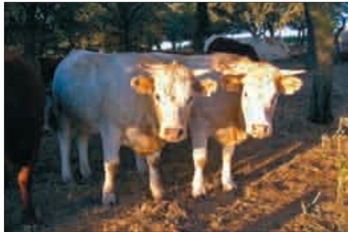
Nueva campaña de saneamiento.

ASAJA ha pedido que la Administración no olvide que la campaña de saneamiento debe adaptarse a las necesidades del ganadero, "y no el ganadero a la campaña". Así, es muy importante que el saneamiento se desarrolle con rapidez para no dificultar el movimiento del ganado extensivo. También ha exigido ASAJA la máxima cautela y prevención a la hora de vacunar a los animales. Además, recuerda la OPA que, en caso de cualquier problema que surgiera y que fuera imputable a la vacunación, la Administración ha de indemnizar los daños, como así se ha comprometido el director general.