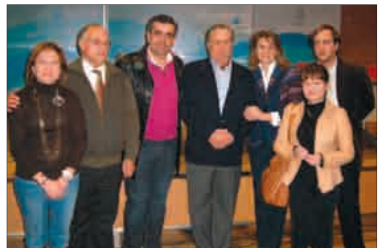
Acto celebrado en Piedrahita, con Dolores de Cospedal.

El presidente de ASAJA quiso así expresar el apoyo de los agricultores y ganaderos, de los jóvenes, las mujeres y familias de los pueblos, en definitiva el apoyo del medio rural a las convocatorias en toda la nación bajo el lema España Vida Sí. "Simple y llanamente son asesinatos, son asesinatos silenciosos, asesinatos de los más indefensos, de los que no se pueden defender y expresar, de aquellos que no tienen voz, de los más débiles. Los culpables tienen nombre y apellidos: Zapatero y Bibiana Aído. Si grave para las familias es la tremenda y grave crisis económica que estamos padeciendo, la mayor crisis sin ningún tipo de dudas para toda la sociedad es la pér-