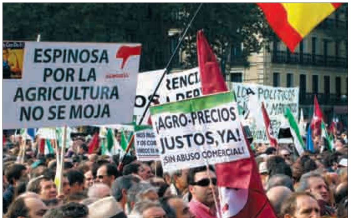
Ahora las estadísticas dan la razón a las reclamaciones, todavía no atendidas, de los agricultores y ganaderos.

Para la organización agraria, estas cifras no tienen que ser utilizadas, una vez más, por nuestros políticos como una constatación inevitable, como si el sector agrario no tuviera arreglo. “El sector agrario no puede estar o dejar de estar de moda, porque los alimentos son necesarios, hoy y en el futuro. El problema, hablando en claro, es que tenemos unos políticos que son unos zoquetes, embarcados en batallas sin utilidad, y que mientras están permitiendo a