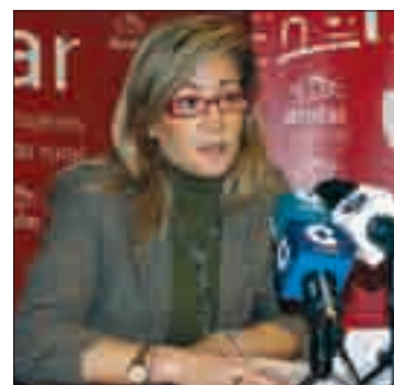
La presidenta nacional de AMFAR.

cionadas ayudas. Por lo tanto, si el Ministerio se propone ahora reestablecer estas ayudas, no está haciendo otra cosa que recuperar una medida que previamente se cargó y que es necesaria para incentivar la incorporación de la mujer en las explotaciones agrarias. La desaparición de estas ayudas ha supuesto un paso atrás en la igualdad que vienen reivindicando las mujeres del campo español, máxime cuando su presencia en el sector es garantía del relevo generacional.