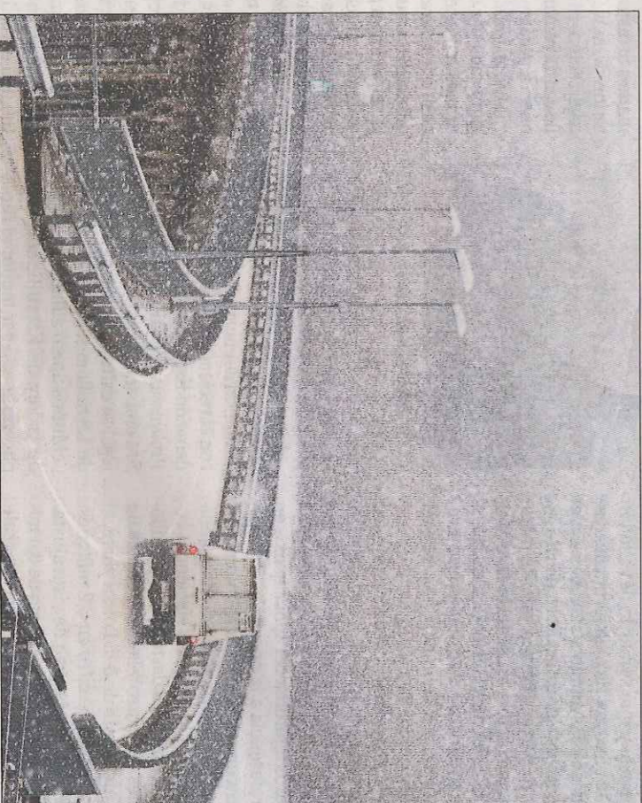
Temporal de nieve ayer cerca de la zona del embalse.