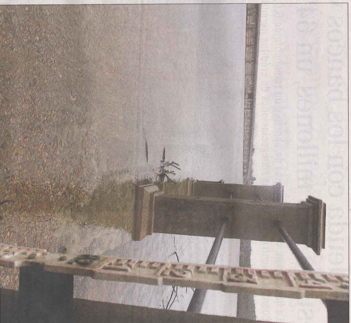
Imagen ayer de la zona del embalse de Cuerda del Pozo.

ostensiblemente ayer y Soria se encontraba en situación de riesgo por nieve. En la capital se produjo una tímida caída de algunos copos pero durante escasos minutos.