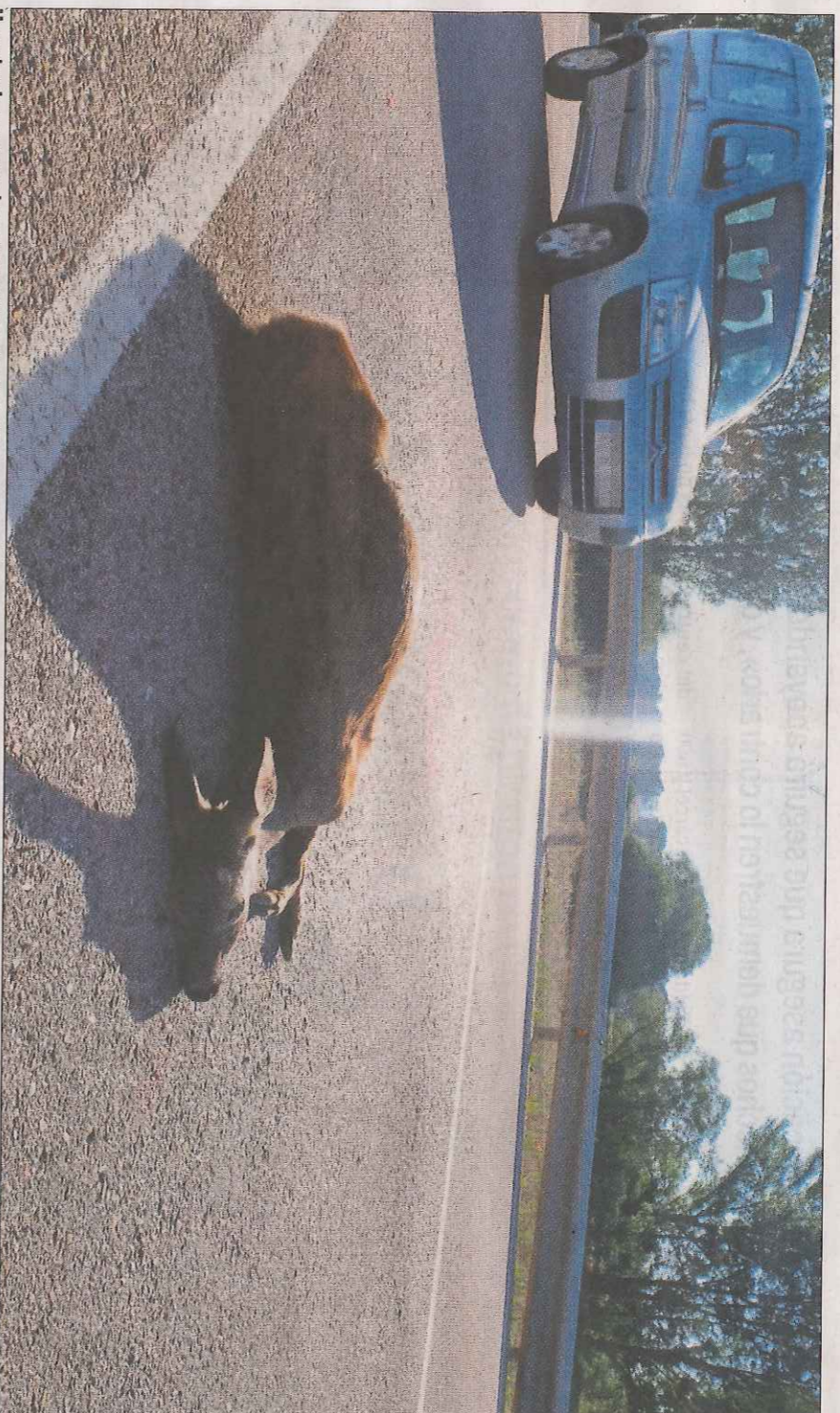
Un animal muerto en la carretera tras un atropello.

En palabras de la representante del Gobierno de España en Soria, «dos de cada tres accidentes los provocan animales, bien es cierto que en ninguno de ellos ha habido personas heridas, pero el peligro está ahí. Es muy preocupante». En 2017, de los 304 accidentes, 205 ocurrieron por culpa de los animales incontrolados. De los 211 accidentes de este trimestre, los corzos causaron 144, es decir, el 68%. Para De Gregorio, «el problema está perfectamente localizado, hay que trabajar en adecuar la cabaña cinegética a las características de los