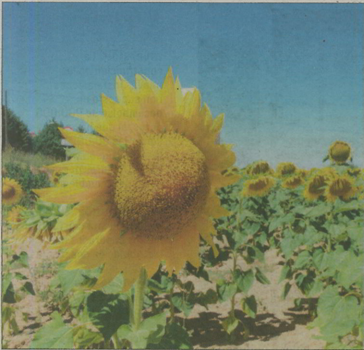
Explotación de cultivo de girasol en Soria.