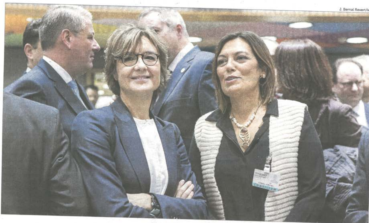
La consejera de Agricultura y Ganadería, Milagros Marcos, y la ministra Isabel García Tejerina, conversan, ayer en Bruselas, momentos antes del comienzo de la reunión del Consejo de Ministros de Agricultura y Pesca de la Unión Europea