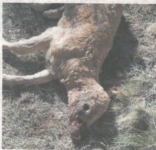
Uno de los corderos muerto por el ataque de los lobos.