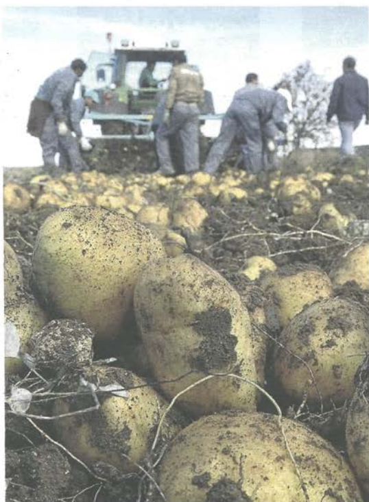
Campo de patatas en la localidad vallisoletana de Campaspero en el pasado mes de abril.