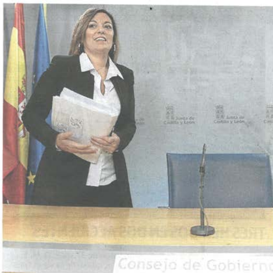
La portavoz, Milagros Marcos, tras el Consejo de Gobierno.

La portavoz del Gobierno autonómico, Milagros Marcos, concluía así un largo balance de las principales actuaciones y problemas del ejercicio que ya se cierra, marcado por claras «complicaciones» por la «necesaria prórroga presupuestaria», por el desafío secesionista y por «importantes conflictos como el energético o la acusada sequía». Una actividad, la de la Administración regio-