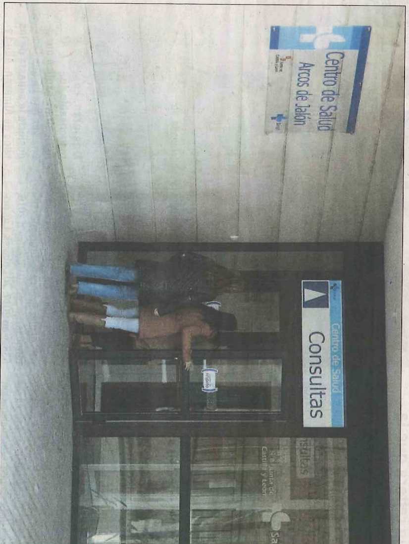
La falta de pediatras se ha puesto de manifiesto tras las quejas de las familias. HDS

Del mismo modo, le reclaman que estudie la propuesta que le ha presentado para cubrir los puestos de difícil cobertura, no sólo en el medio rural sino también en el urbano. Esta propuesta contempla medidas económicas y de otra índole con el recordatorio de que «hay otras administraciones que ya practican esta política», indica el sindicato en nota de prensa. Por parte de CC OO las medidas que la Consejería de Sanidad debería considerar comienzan por incentivar a los profesionales y no mediante las Unidades de Gestión Clínica. «También hace falta que se abra el concurso de traslados abierto y permanente y volver a las 35 horas laborales, ya que el incremento de jornada supone una sobrecarga que