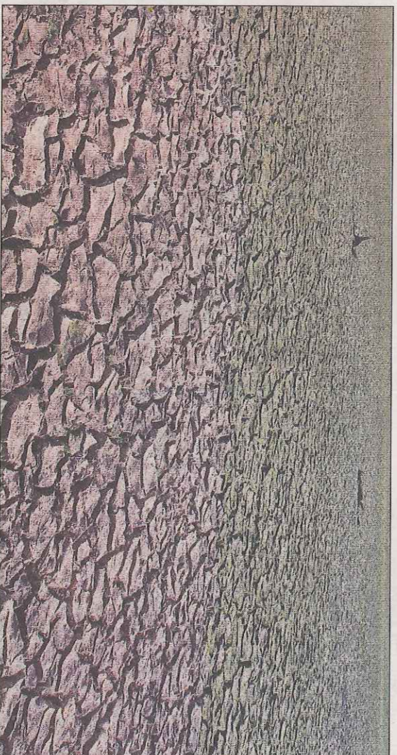
Imagen del pantano en otoño. MARIO TEJEDOR

La organización agraria pretende que estas peticiones se tengan en cuenta en la posterior modificación de la orden de módulos antes de la declaración de la Renta. «X todo indica que el Gobierno atenderá esta solicitud de la OPA, como así se lo ha confirmado por escrito la subdelegada del Gobierno a los responsa-