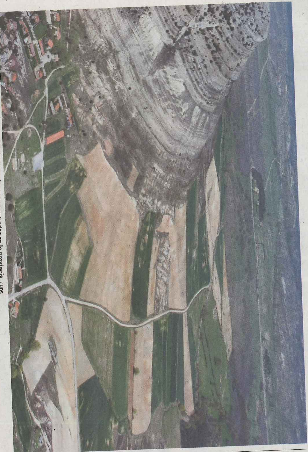
Hay más de 400 procesos concluidos y casi 430.000 hectáreas concentradas en la provincia. / HNS