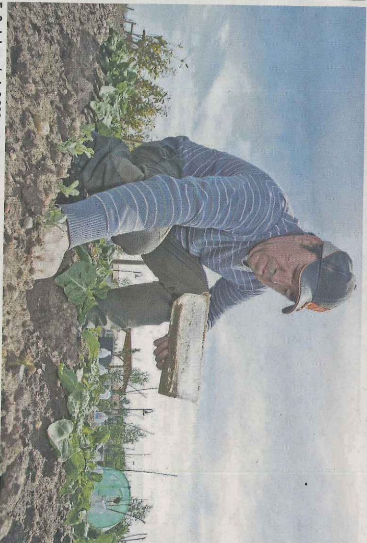
En Soria hay más de 2.000 agricultores activos.

Las organizaciones agrarias Asaja, COAG y UPA se han mostrado públicamente a favor de la continuidad de la definición actual, ante la flexibilidad en su enunciado introducida por Bruselas con la aprobación del capítulo agrícola en el marco financiero plurianual.