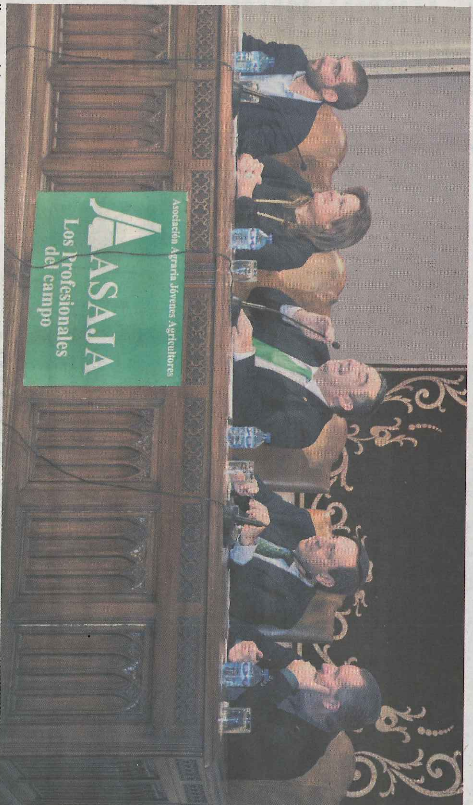
Un momento de la asamblea de Asaja.