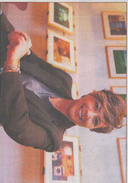
La periodista Sonsóles Ónega. EL MUNDO

Conocer sus opiniones sobre la literatura e historia española, el periodismo, la actualidad informativa, la influencia social de los medios de comunicación, los géneros literarios y periodísticos, la utilización del idioma, la repercusión de las nuevas tecnologías y los nuevos modelos de comunicación surtidos a partir de internet, constituyen algunas de las cuestiones que se ponen sobre la mesa durante este diálogo.