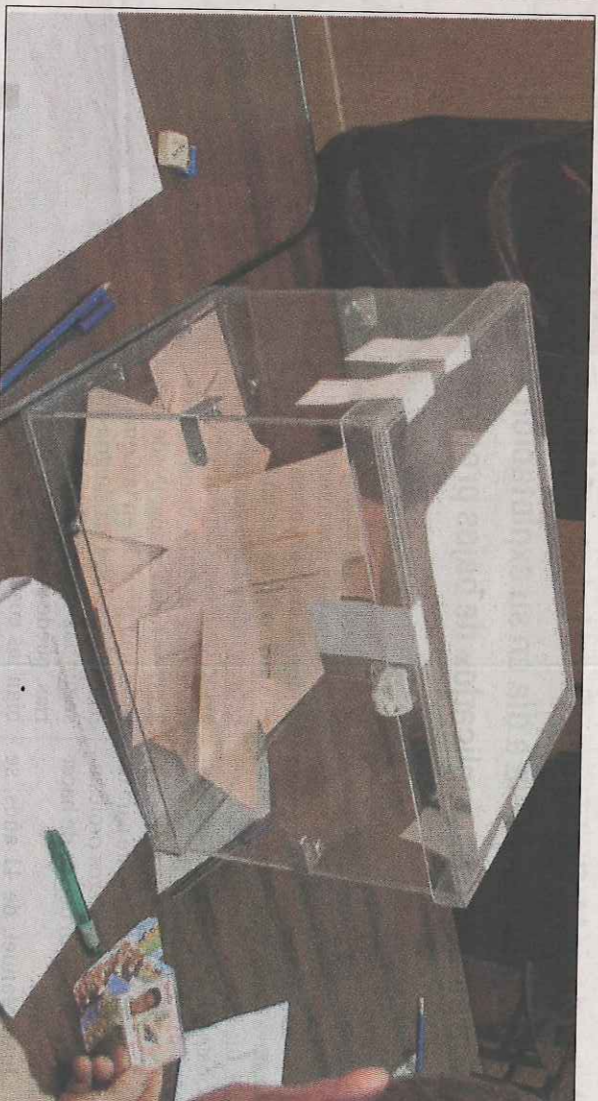
Un momento de la votación en las últimas elecciones agrarias de 2012.

Las Opas apurará estos días la campaña de movilización animan-