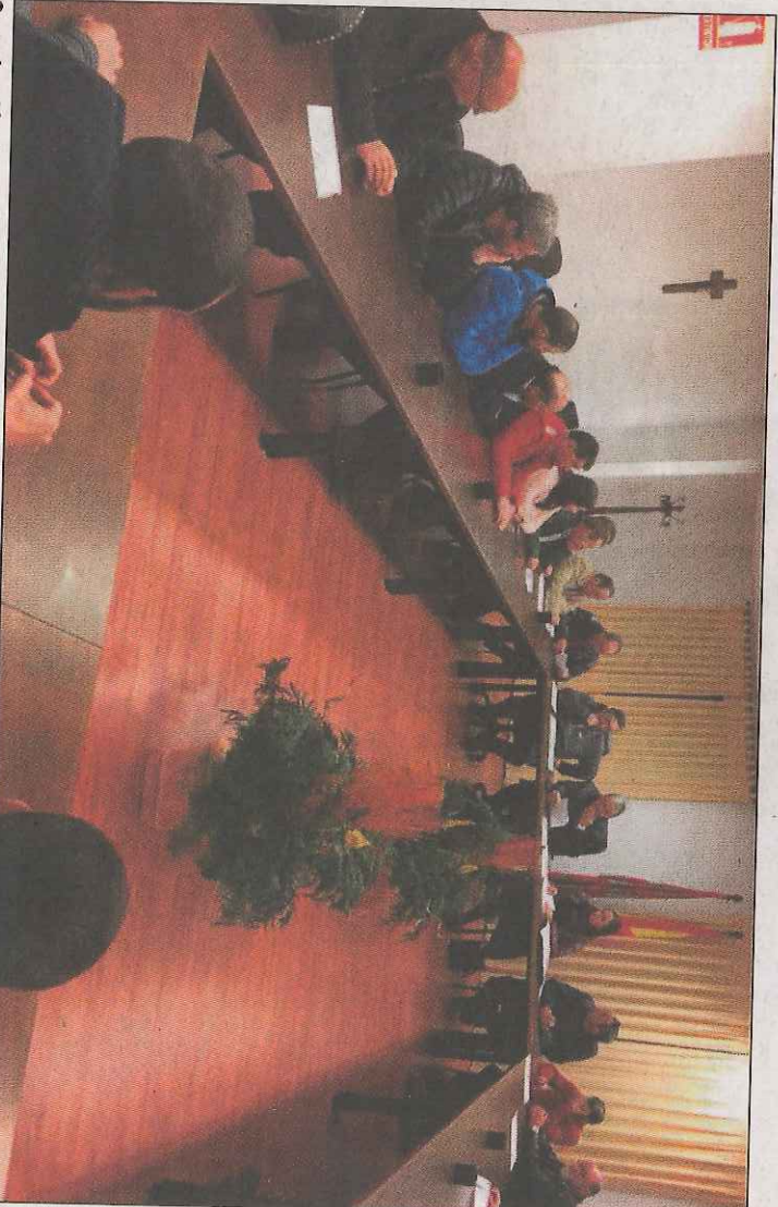
Constitución del pleno de la Cámara Agraria Provincial de Soria.

Muñoz recuerda que hace tiempo planteó que podrían asumir los gastos entre las organizaciones agrarias en función de su representatividad en la Cámara. «Ahora mismo UCCL cuenta con 11 vocales, Asaja con ocho y UPA-COAG con seis, de modo que ahora mismo la financiación tendría que ser