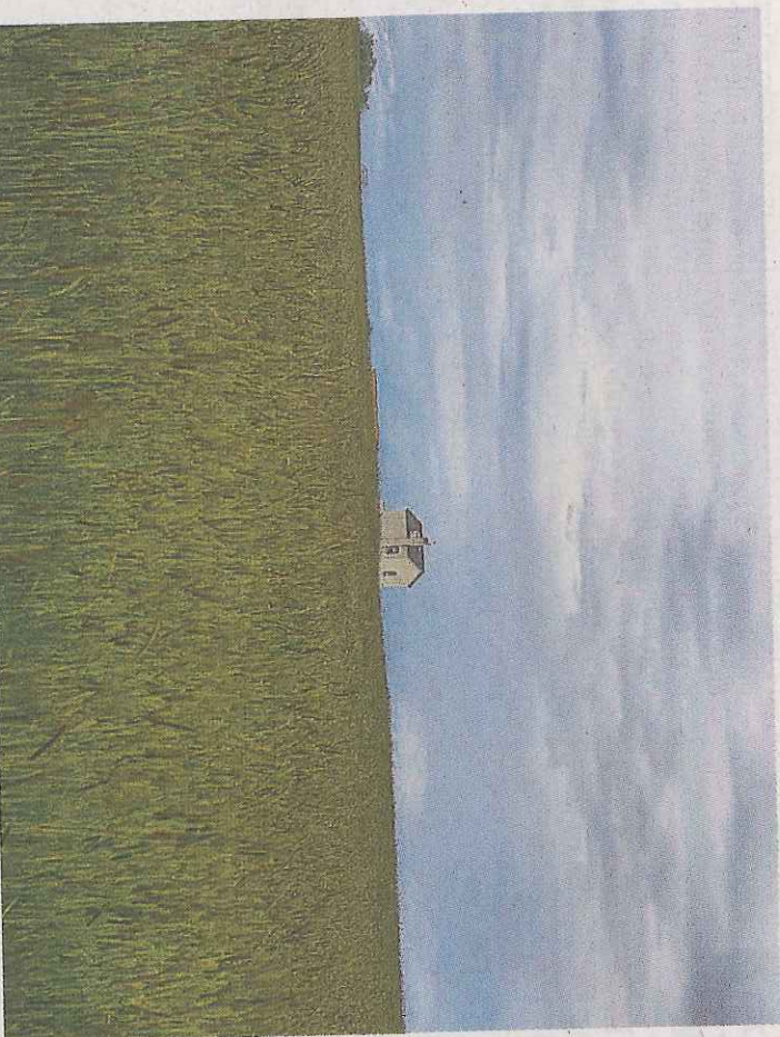
Campo de cereal en una explotación salmantina.

El trigo se confirma como cereal principal en una campaña que sigue mirando al cielo