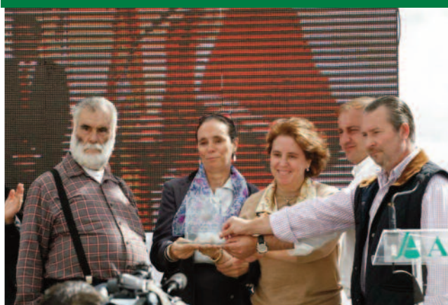
En 2013 a la que fuera ministra de Agricultura, Loyola de Palacio, a título póstumo