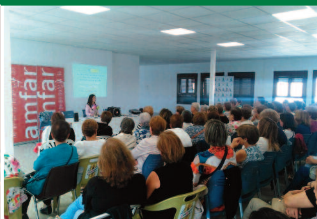
Jornadas informativas de la mano de Amfar