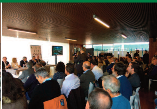
Jornada sobre cambio climático y ganadería en Ávila