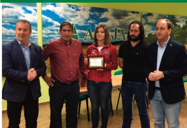
La Insignia de Oro 2017 fue para los ganaderos trashumantes