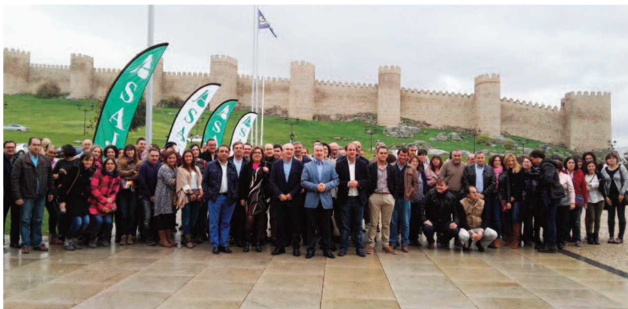
Convenciones anuales de empleados de ASAJA Castilla y León