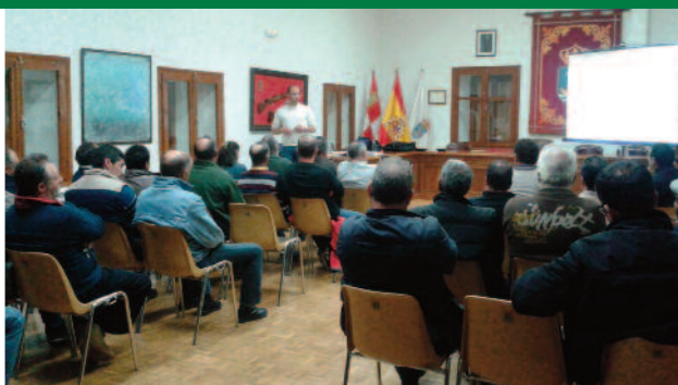
Cursos de bienestar animal