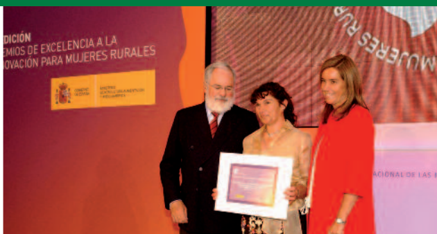
Premio a la Excelencia para la Innovación de las Mujeres Rurales del Ministerio de Agricultura en 2012