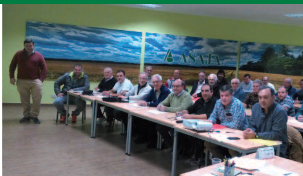
Cursos de adaptación de fitosanitarios