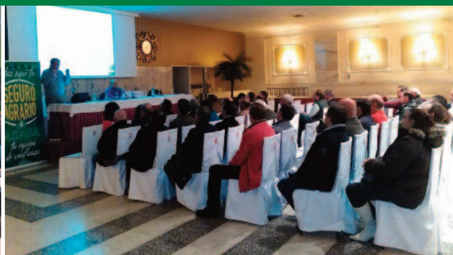
Charlas sobre seguro agrario