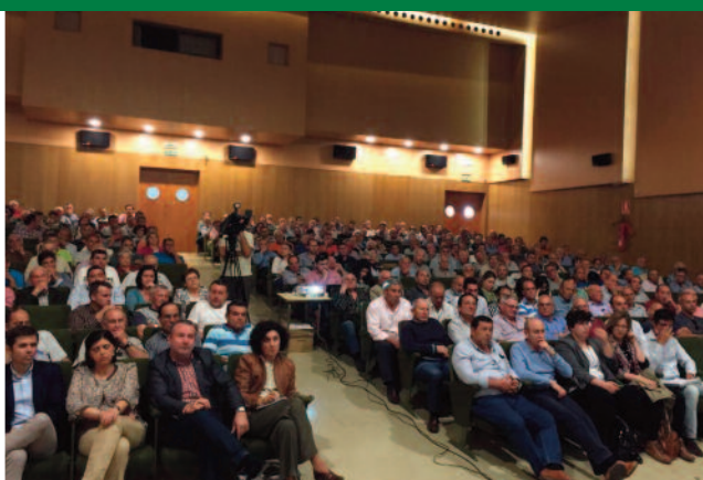
Jornada sobre "la problemática del riego por sondeo"