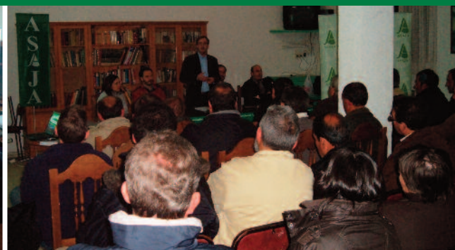
Charlas informativas sobre la PAC