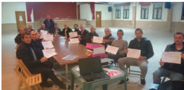
Cursos de fitosanitarios