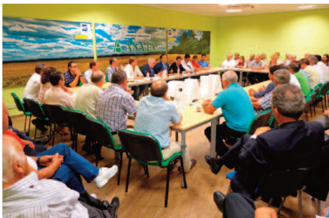
Reunión con Arias Cañete en Ávila