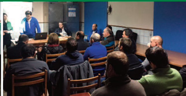
Charlas sobre seguro ganadero