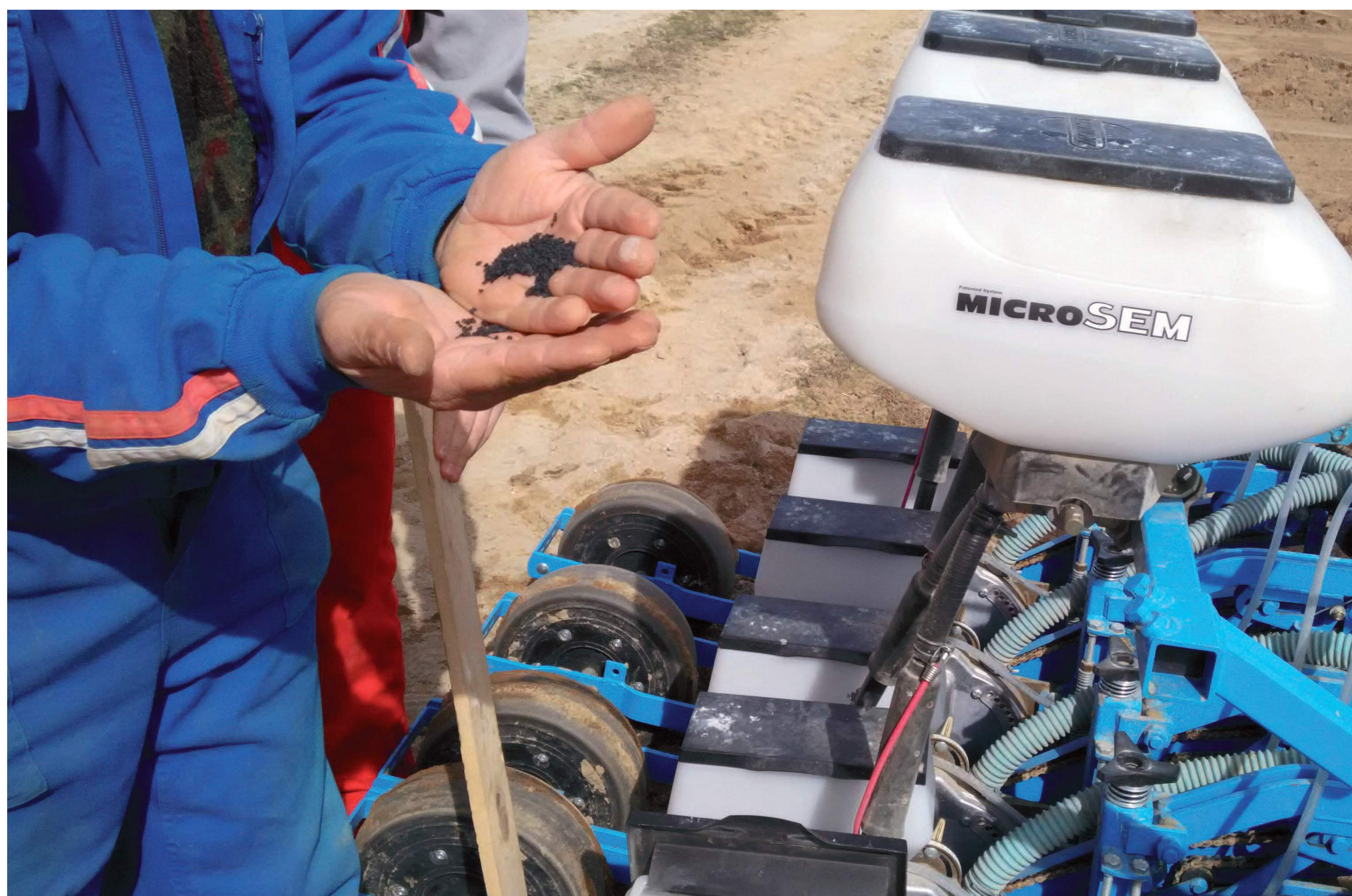
Sembradora que aún no se ha podido utilizar en decenas de localidades de la provincia. Abajo, parcela anegada, a causa de las lluvias caídas en Madrigal de las Altas Torres

Misma situación que encontramos con la siembra de la cebolla, que suele realizarse en la segunda mitad del mes de marzo,