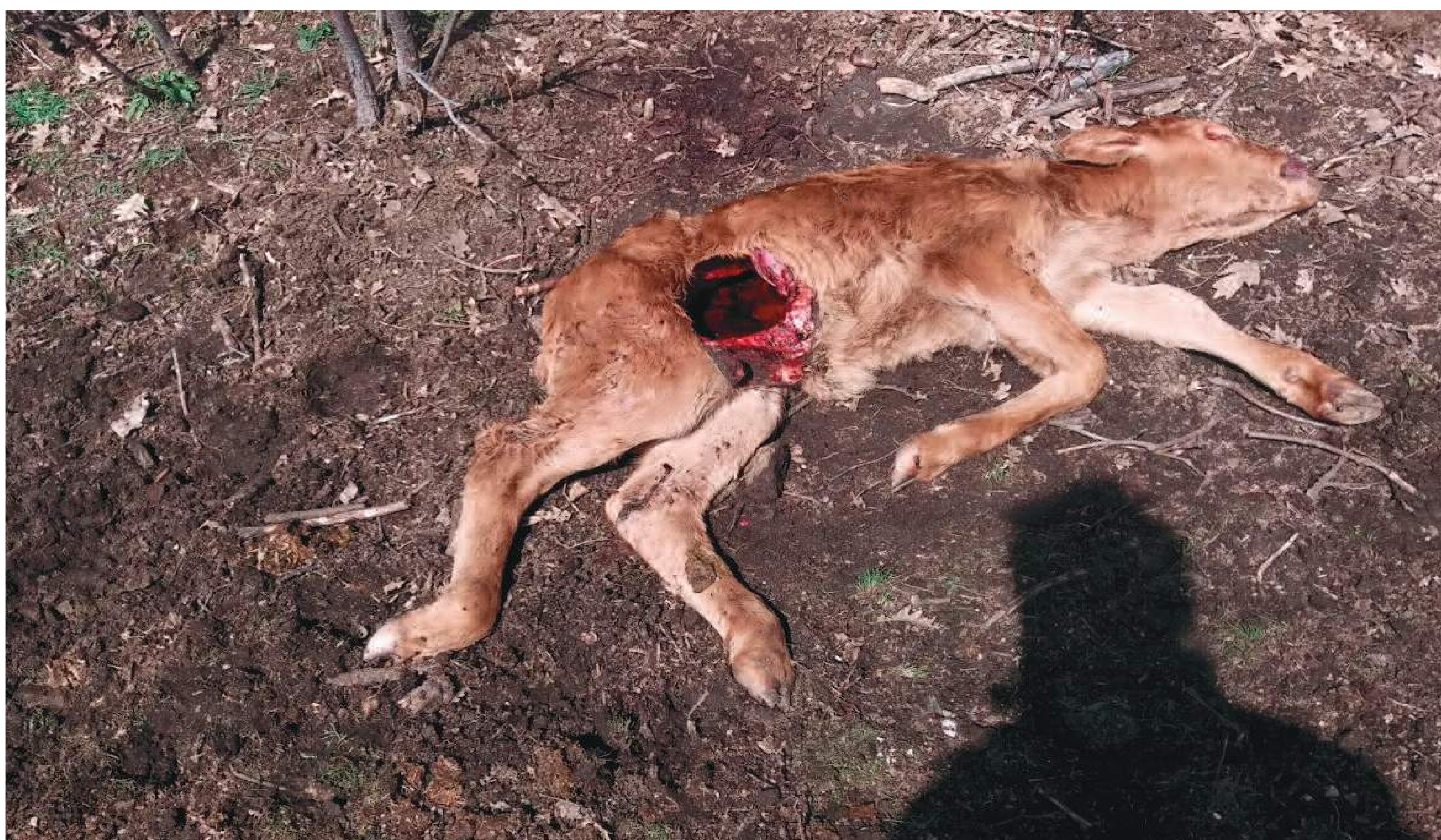
Ataque de lobos en Zapardiel de la Cañada, dos ataques de lobo en tres días, cinco muertes