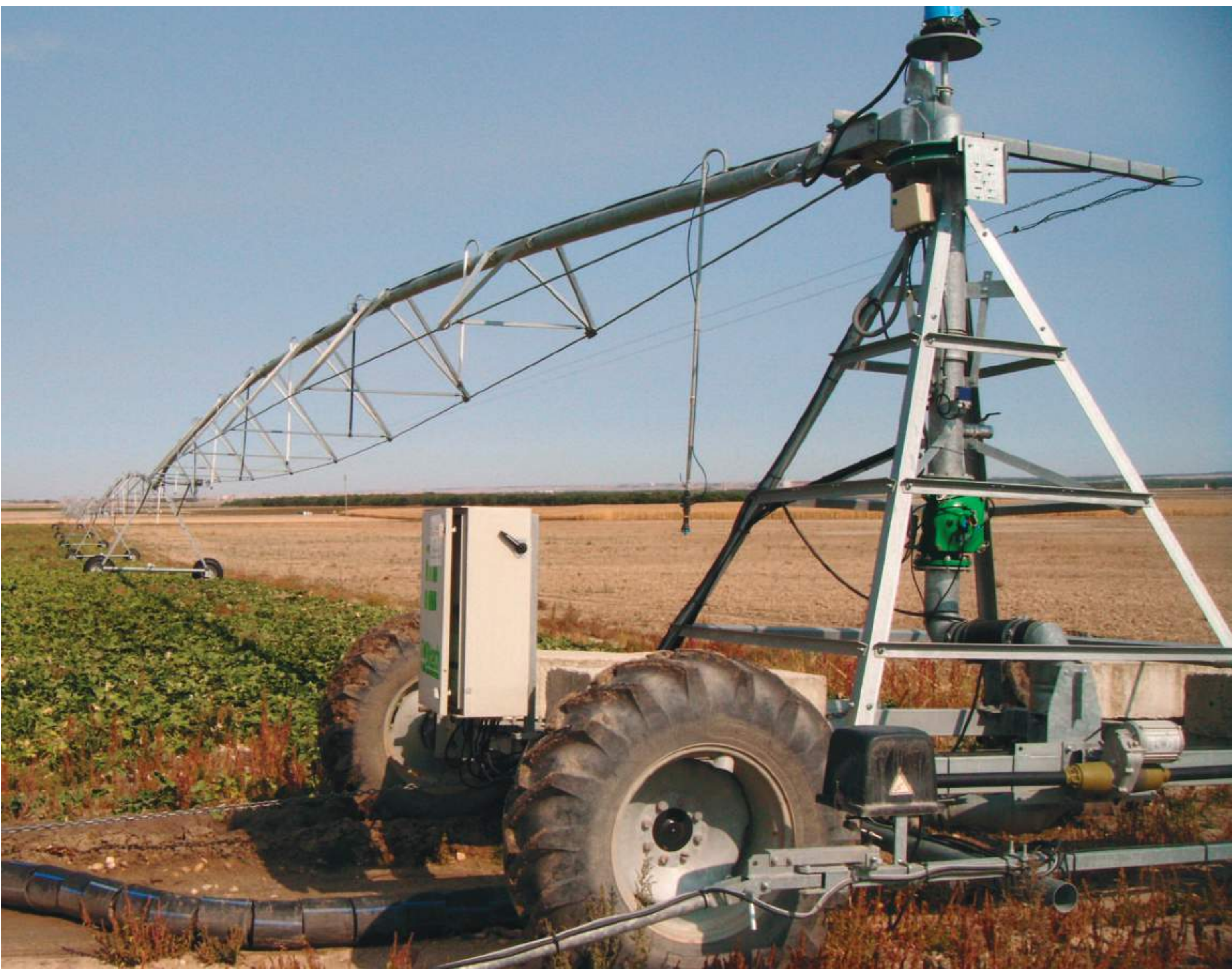
Pivot instalado en la Moraña

Muchos son los agricultores que aplauden la medida, pero aseguran, es tan solo un parche para un corto periodo de tiempo y hay que esperar a la letra pequeña del correspondiente desarrollo reglamentario.