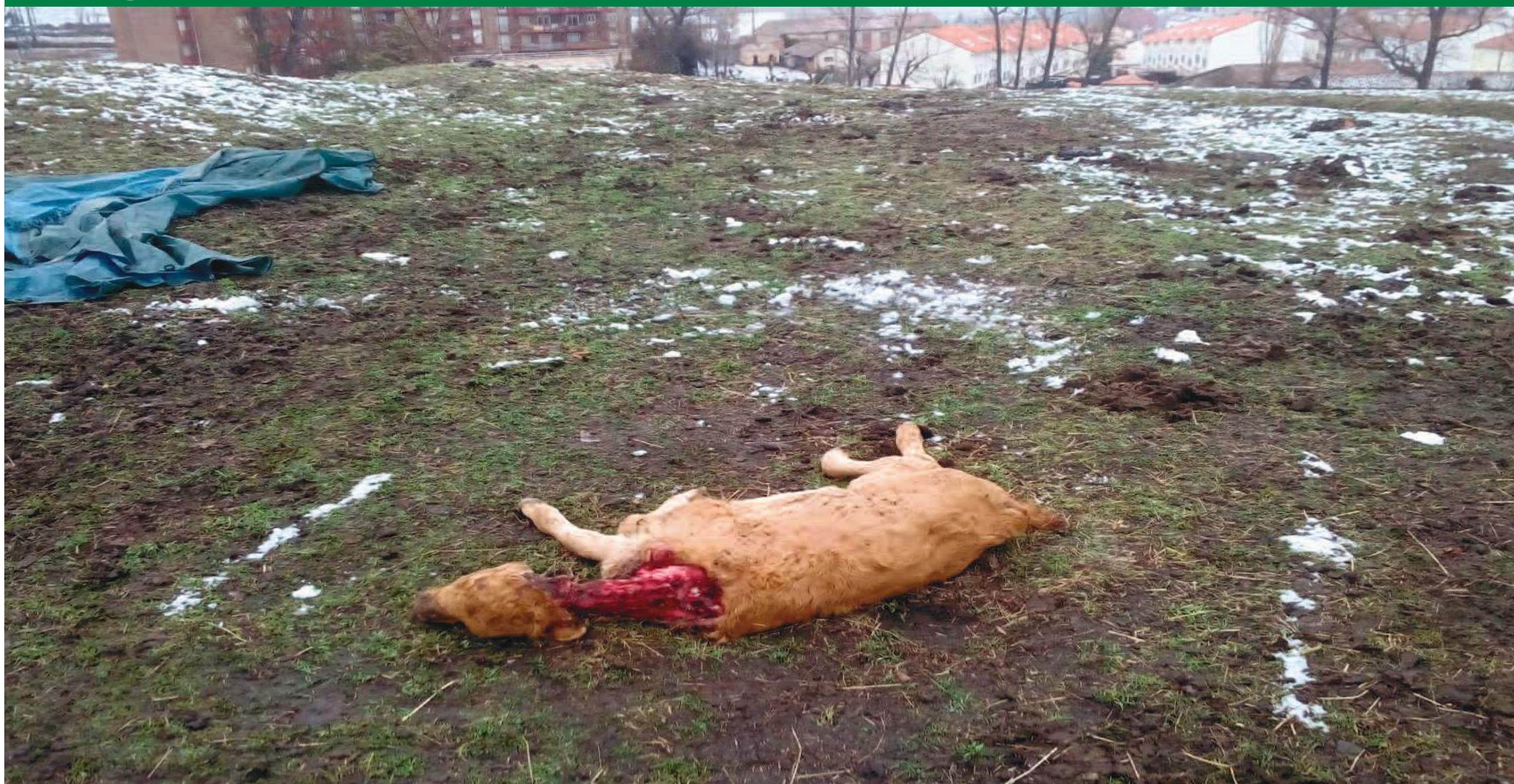
Ataque de lobos, con el resultado de una ternera degollada, a tan solo 500 metros del casco urbano de Piedrahíta