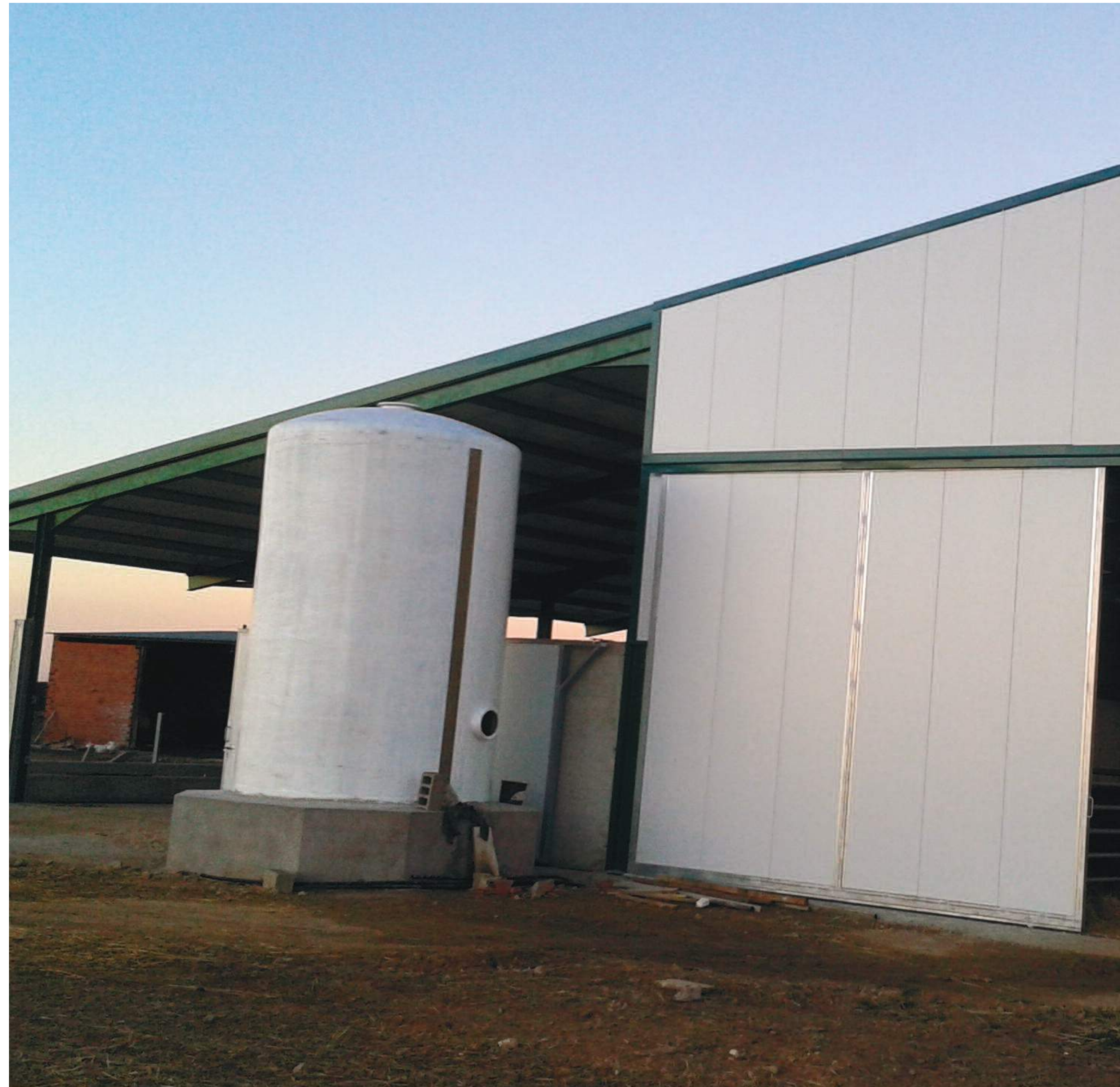
Instalación ganadera de la provincia de Ávila. Abajo, ganado porcino

Para saber si se está al día o no en esta cuestión, el presidente provincial tiene claro que hay que rodearse de técnicos cualificados y ha señalado que ASAJA cuenta con