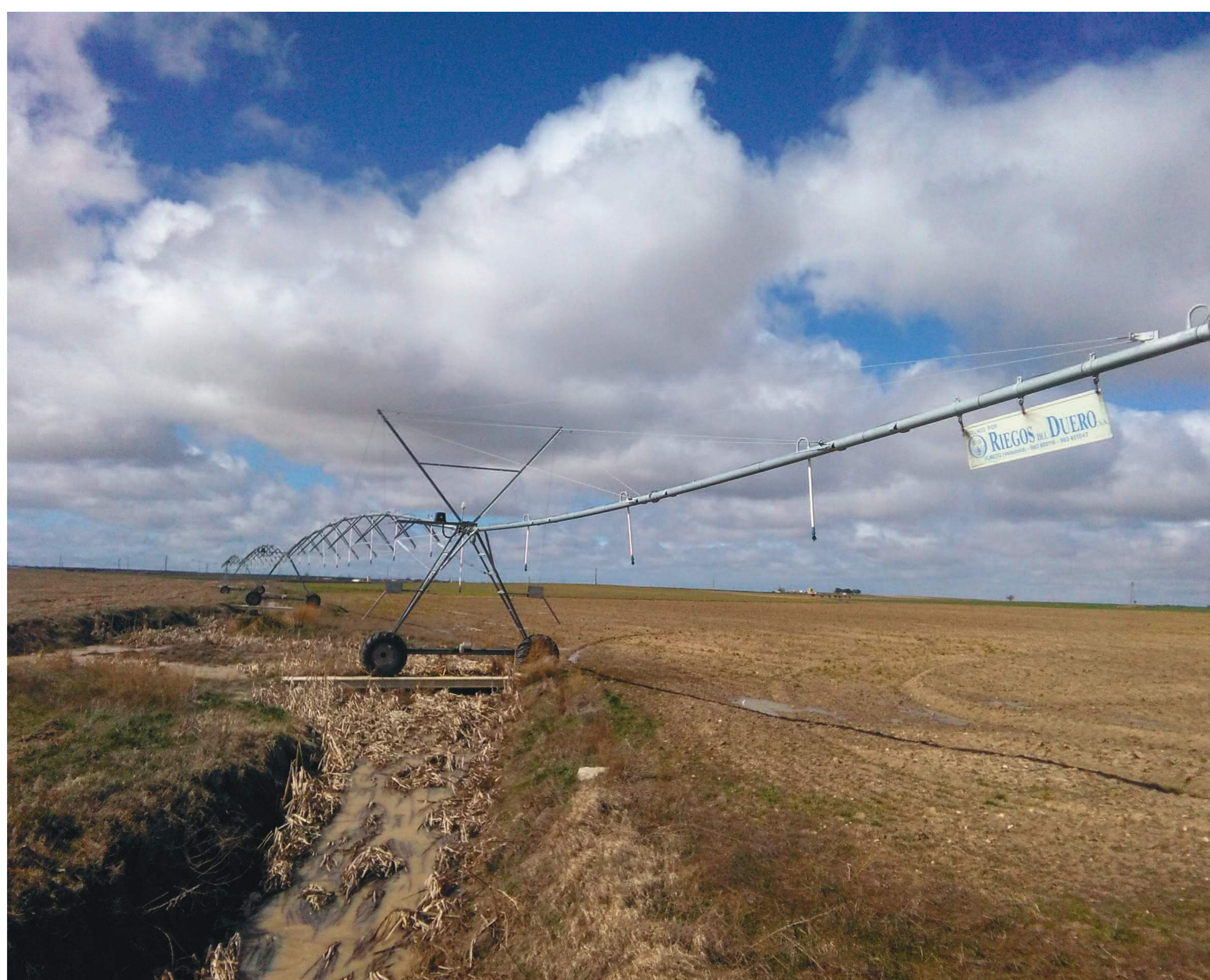
Pivot en una parcela de regadío

El acuerdo de la comisión permanente de la sequía contempla diferentes medidas en sus dos ámbitos de aplicación, así: en los ríos