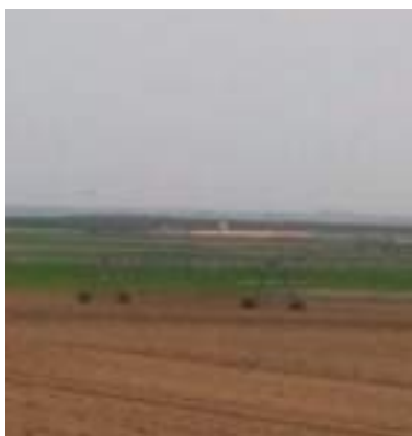
Pivot en un campo de remolacha

Desde la cartera ministerial tienen claro que la mejora de la eficiencia hídrica ha supuesto un incremento significativo de las necesidades de energía para hacer