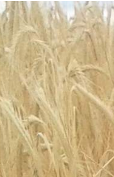
Campo de cereal

El 30% en las líneas de seguros para la cobertura de los gastos derivados de la retirada y destrucción de animales muertos en la explotación.