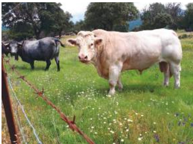
Cercado de explotación ganadera

Podrán ser beneficiarios de estas ayudas las entidades locales, que sean titulares o gestores de pastos de aprovechamiento común en el ámbito territorial de Castilla y León. Son subvencionales la construcción