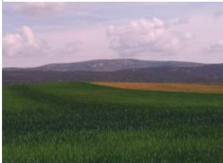
Campo de trigo en la localidad abulense de La Torre

tados por la "Roya Amarilla". Por eso este año tiene especial cuidado con sus parcelas. Subraya que la información que ofrece la administración es escasa.