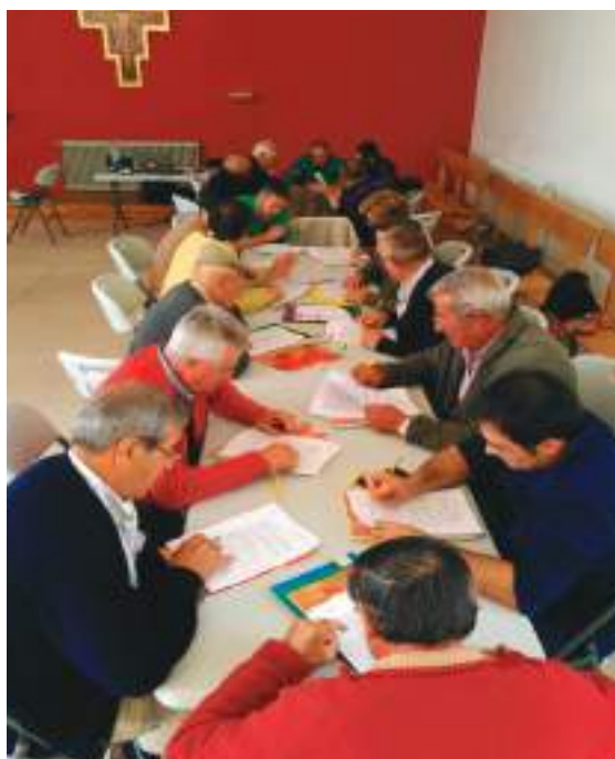
Los alumnos realizando el examen del curso