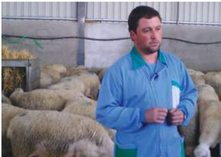
Joven ganadero en su explotación de ovino