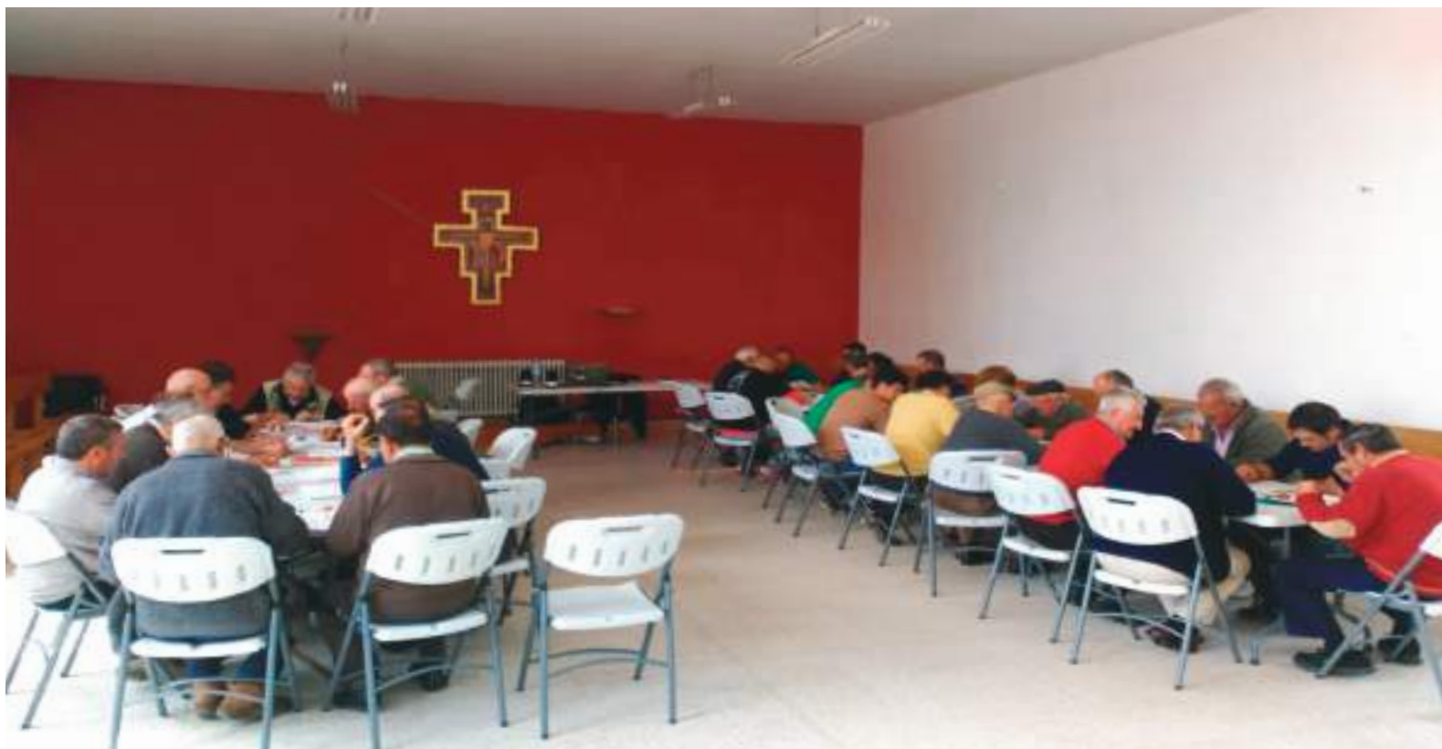
Alumnos del curso de Fitosanitarios celebrado del 4 al 8 de junio en el término municipal de Diego del Carpio