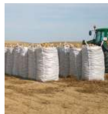
Recolección de patatas

La exportación española de patata en 2017 aumentó un 5 por ciento en volumen con relación a 2017,