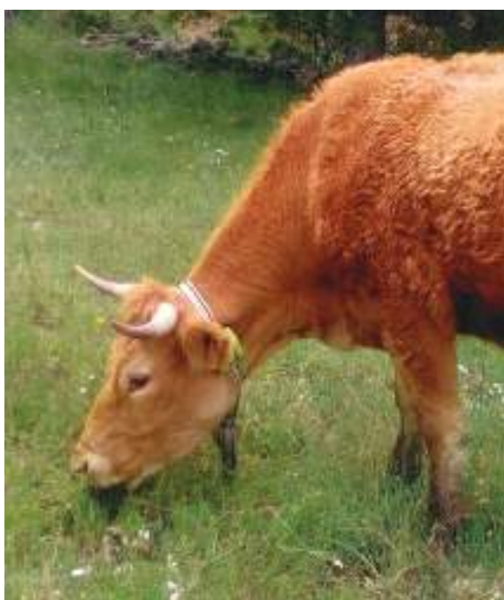
Ganado vacuno con localizador GPS