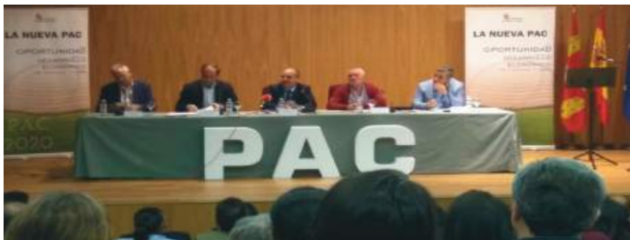
Ponentes jornada: "La Nueva PAC, una oportunidad para el desarrollo económico de Castilla y León"