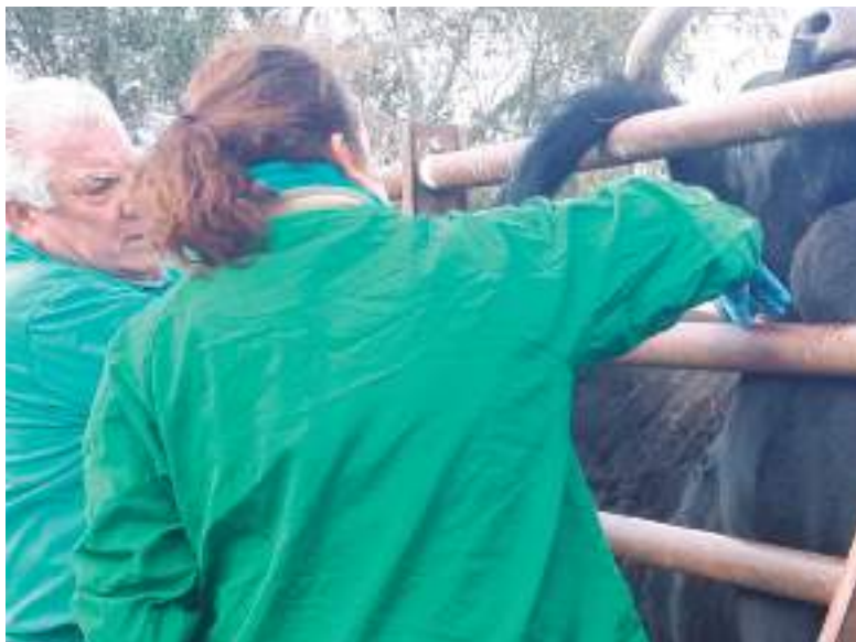
Veterinaria realizando labores de saneamiento