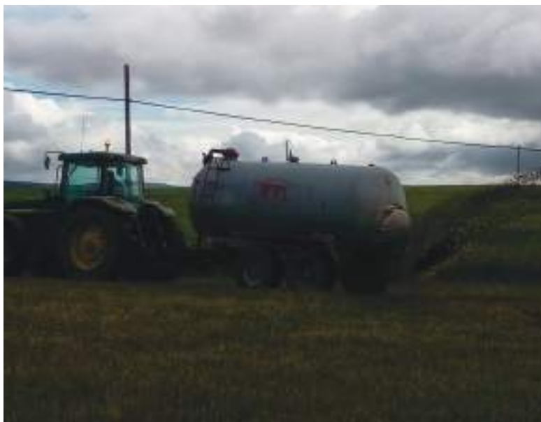
Aplicación de purines en abanico

El tiempo apremia. Es lo que debe de pensar el sector agroganadero, porque adaptarse a una nueva normativa sobre gestión de purines. En este sentido ASAJA-Ávila ha calificado como “imposible” poder cumplir a corto plazo la normativa sobre gestión de purines, aprobada por el Ministerio de Agricultura. Esta normativa prohíbe, desde el 1 de enero de 2019, la aplicación de purín en superficies agrícolas mediante sistemas de plato, abanico y cañones, así como obliga al pronto enterrado de estiércoles sólido. Las consecuencias de esta normativa son tanto para los propietarios de las explotaciones ganaderas como para los agricultores, ya que habría que adaptar la maquinaria existente e incluso adquirir maquinaria nueva que requiere tractores de mayor potencia y cambiar también la forma de aplicar los purines a la tierra. Desde que tuvo conocimiento de la posibilidad de que se aprobaran estas nor-