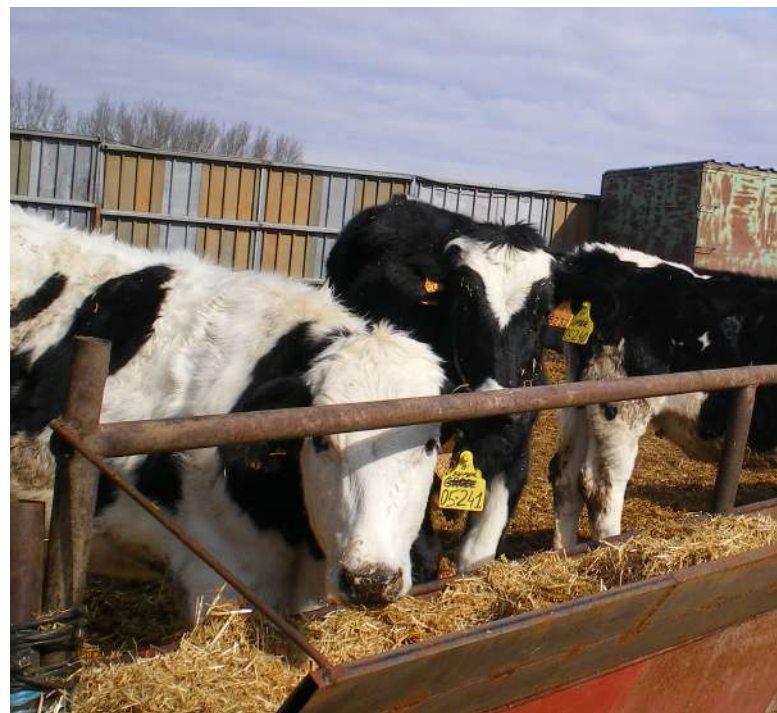
Vacuno de aptitud cárnica (lidia incluido)

Se aplicará el baremo al 100% en caso de vacío sanitario. Estos se incrementarán en caso de ganado ecológico, de pertenencia a una explotación de defensa sanitaria ganadera o si se trata de razas autóctonas.