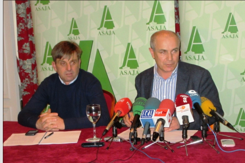
Presentación Anuario 2013

El documento es muy valorado por los medios de comunicación por la abundancia de datos y el rigor de los mismos y de su contenido se dio amplia difusión en los periódicos, las emisoras de radio, la televisión local y los medios digitales. Se puede consultar en la web de ASAJA León..