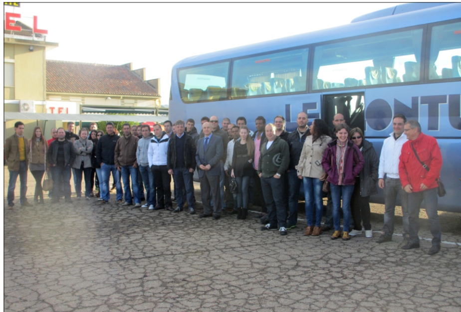
En la imagen, grupo de jóvenes de León que participó en la conferencia.

ASAJA está demandando políticas específicas para los jóvenes que se incorporan al campo con el fin de que puedan formar explotaciones viables y competitivas que generen empleo y riqueza en los territorios, manteniendo vivo el medio rural. ASAJA tramita la mayoría de los cursos de formación que se les exigen para obtener ayudas o ejercer la actividad. La organización agraria está tratando esta cuestión de los jóvenes con carácter de transversalidad, por tanto se tiene en cuenta en todas las decisiones de política agraria que defiende el sindicato.