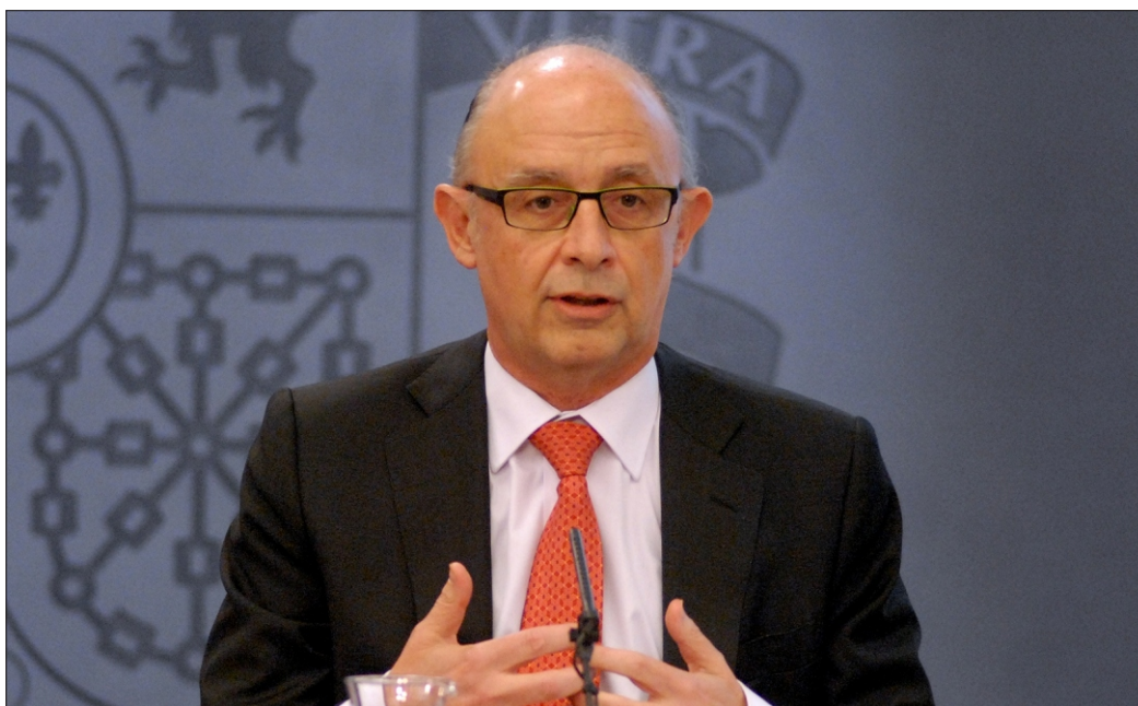
Cristóbal Montoro, Ministro de Hacienda

es elevado, pero eso no significa que los beneficios también lo sean, porque son explotaciones con unos gastos muy fuertes, como puede ser ganaderías de leche o intensivas, o agriculturas de regadío”, subraya ASAJA.