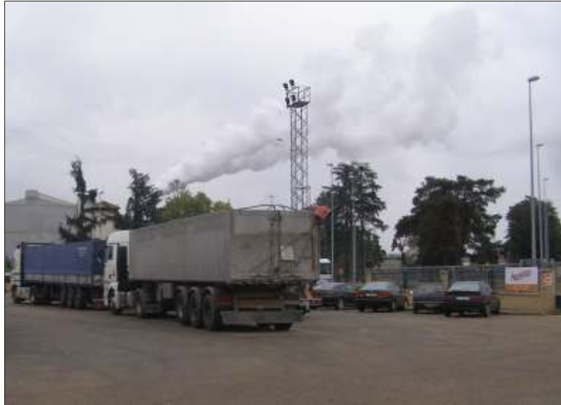
Planta de Azucarera Iberia (British Sugar) en La Bañeza