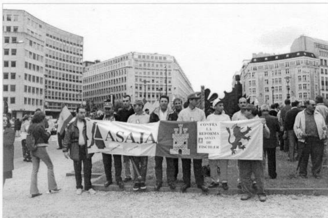
Manifestación en Bruselas contra la reforma de la PAC. Junio de 2002.

* Solo hay pequeñas variaciones en los importes del suplemento de pago del trigo duro, incluyendo las regiones no tradicionales para las que la última campaña con derecho a cobro será la 2006/2007, en la que la ayuda será de 46 euros por hectárea (para la 2004 - 2005, se fija en 93 euros por hectárea), sin superar las 4.000 de derecho para España. ■