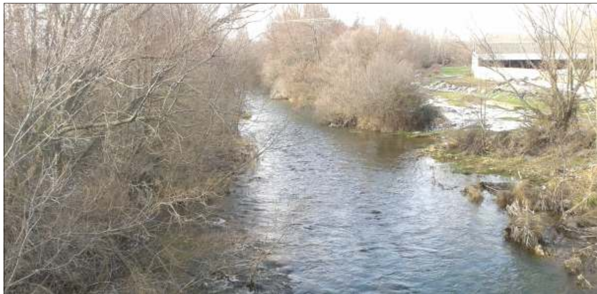
El río Tuerto crecido a su paso por San Justo de la Vega

ASAJA informará a todos sus asociados de la importancia de tramitar las solicitudes de indemnización por daños patrimo-