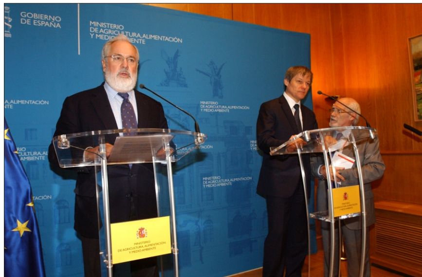
El ministro Arias Cañeta, junto al comisario de Agricultura, Dacian Cioloș.

por ciento, aunque contra el caso de los fondos recortados en concepto modulación, que revierten de nuevo al sector a través de distintos programas, este recorte del 5 por ciento, que Bruselas justifica por la aplicación de “mecanismos de disciplina fi-