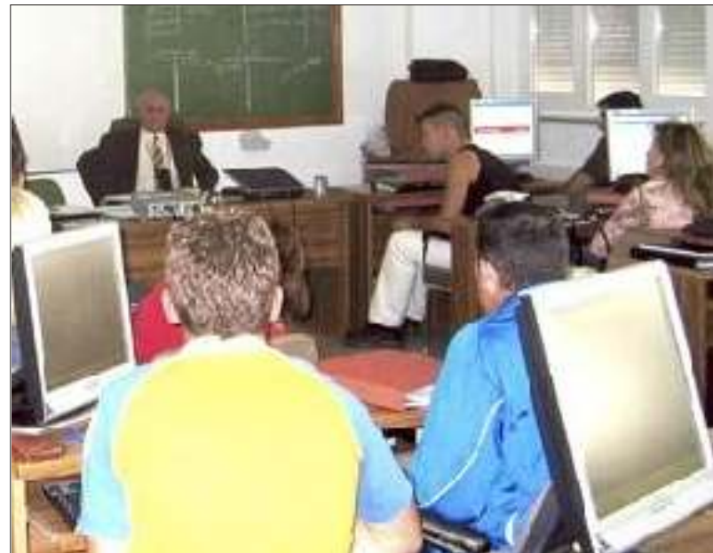
Momento de una clase de un curso de incorporación a la empresa agraria

Comunicamos que en León, tendrá horario de mañana, y durará 150 horas a razón de 4 horas diarias. Los que inicialmente puedan estar interesados, han de inscribirse en cualquiera de las oficinas de la organización. ASAJA no exige ser socio para participar en estos cursos, aunque en caso necesario, se priorizará en los socios o familiares directos de so-