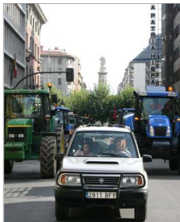
Tractores por las calles de la capital leonesa