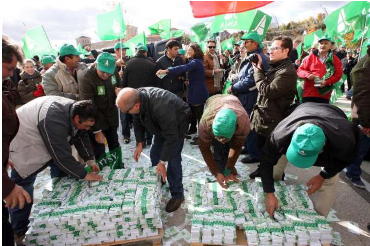
Miles de billetes para protestar por los recortes

ASAJA siempre ha sabido que si no se consigna dinero en los presupuestos de las administraciones que se aprueban cada año en trámite parlamentario, después no habrá líneas de ayuda para apoyar a los agricultores y ganaderos. Por eso ASAJA siempre se ha posicionado sobre este tema, en tiempo y en forma, exigiendo que se acordasen más del campo cuando había dinero y exigiendo que seamos un sector prioritario ahora que no lo hay o hay menos. La situación actual es dramática después de dos tres años de recortes tanto por parte de la Junta como del Gobierno, recortes que han llevado a los departamentos de Agricultura a pagar nóminas de funcionarios, cumplir con los compromisos de los programas que llevan cofinanciación europea y