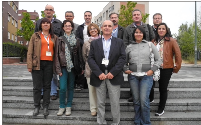
Plantilla que trabaja en las oficinas de ASAJA

Los servicios de ASAJA son los más valorados por los profesionales del campo de la provincia de León y prueba de ello es que ASAJA tramita más de 2.500 expedientes de la PAC cada año, más del doble que el resto de organizaciones juntas. En ASAJA tramitan sus expedientes de incorporación a la agricultura uno de cada dos jóvenes que se inician en la actividad y se tramita cada año más de un tercio de todos los expedientes de modernización de explotaciones en los llamados planes de mejora. Destacan también los servicios fiscales en la tramitación de la declaración del IRPF, los servicios de asesoría laboral para los agricultores que contratan asalariados fijos o en trabajos de campaña, los múltiples servicios de gestoría, la tramitación de los seguros agrario y pecuarios o el servicio de seguros generales que se está prestando a los mejores precios y condiciones del mercado. ASAJA es líder en impartir formación de calidad y así destacan los cursos de incorporación a la empresa agraria, los cursos sobre informática y nuevas tecnologías, cursos para manipular fitosanitarios y zoonosológicos, cursos para el transporte de mercancías peligrosas, o cursos de bienestar animal por citar algunos ejemplos. ASAJA tramita todo el paquete de ayudas agroambientales, líneas de apoyo convocadas por los diferentes departamentos de la consejería de Agricultura, la gestión de la devolución del impuesto del gasó-