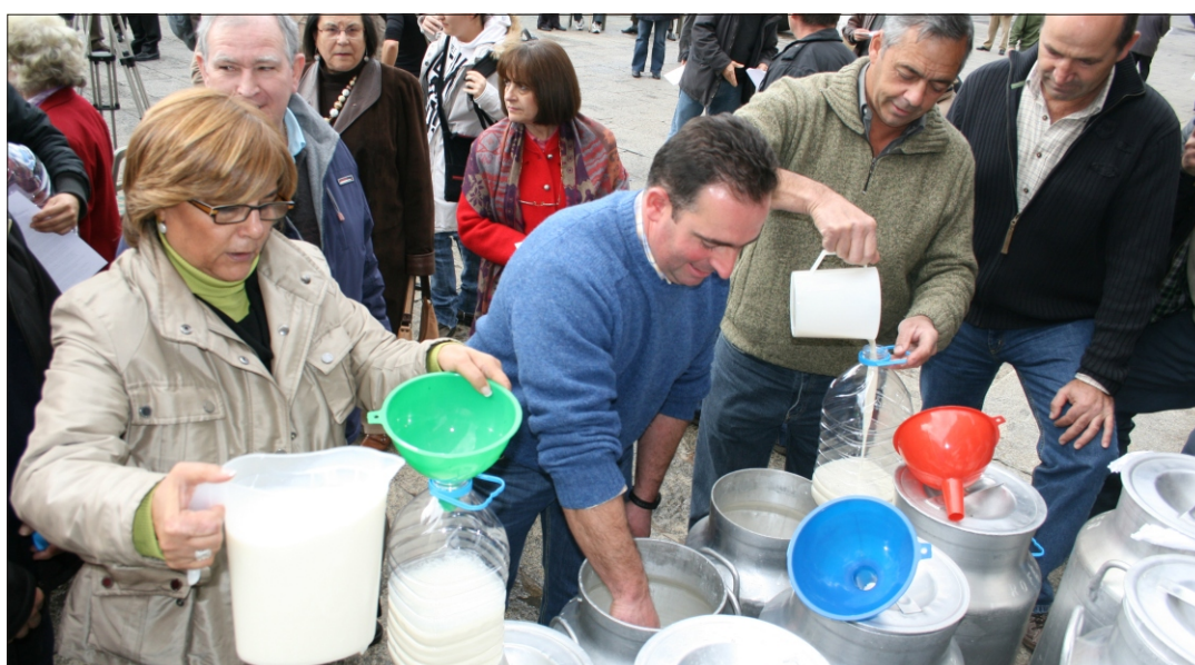
Repartiendo leche en el centro de León