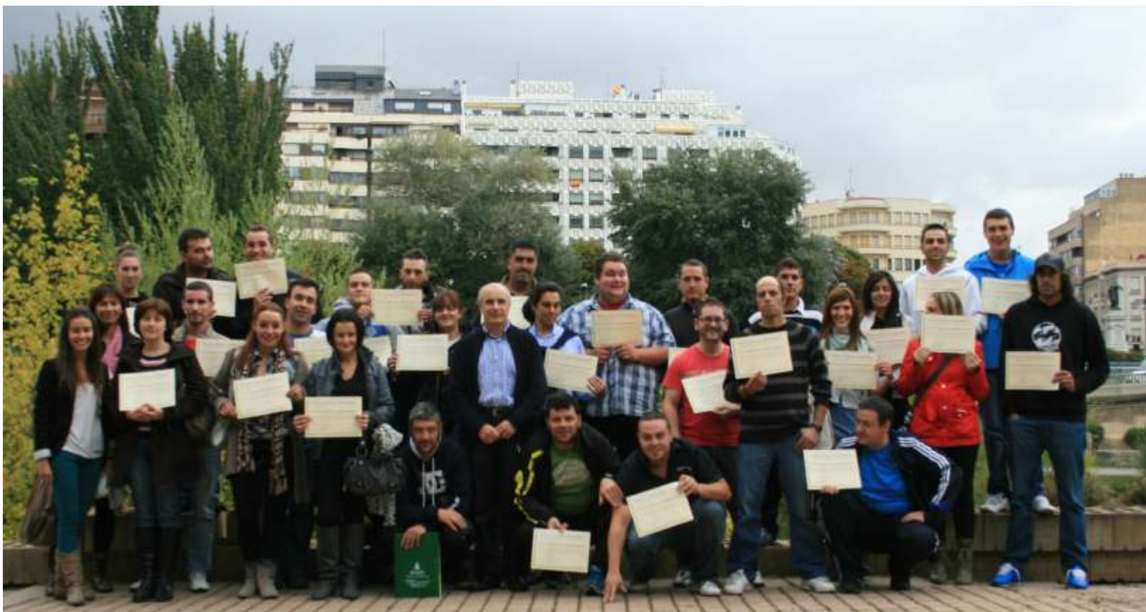
Jóvenes en un curso de ASAJA posando con sus diplomas