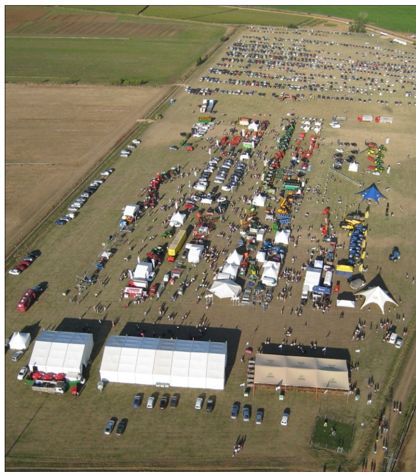
Foto aérea del Campeonato de Arada celebrado en León

Nunca nadie en la provincia de León ha conseguido un éxito tan convocando a los agricultores a un acto lúdico y profesional a la vez.