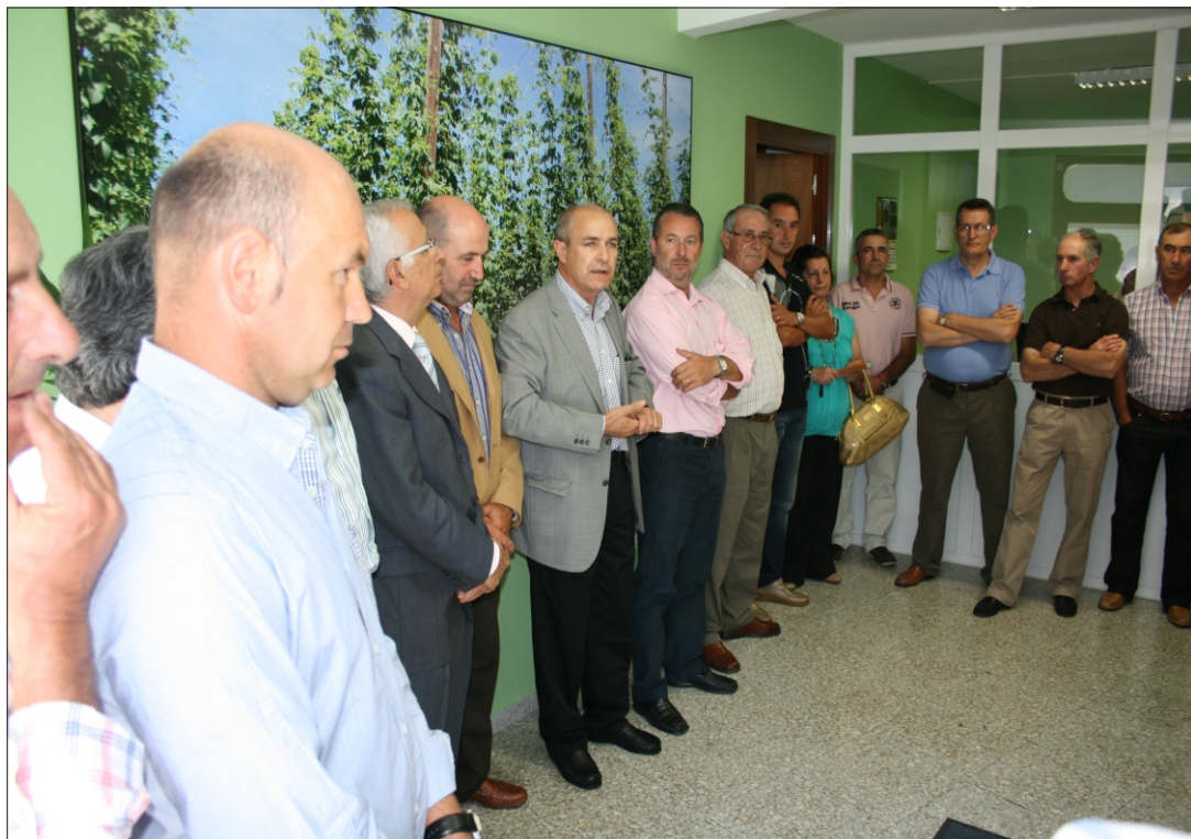
Interior de la nueva oficina en Carrizo de la Ribera

La oficina de Carrizo ha tenido una buena acogida en este importante pueblo de la ribera, lo que se ha traducido en la tramitación de ayudas de la PAC, servicios fiscales, seguros agrarios y ganaderos, información y un importante incremento de los socios y simpatizantes en su zona de influencia.