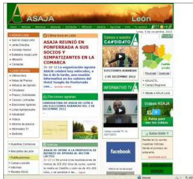
La web de ASAJA , la más utilizada del sector

dió hace muchos años y desde entonces tiene una página web – www.asajaleon.com – que no tienen otras organizaciones agrarias provinciales, que es una de las principales web corporativas de las empresas y asociaciones leonesas y que está abierta a la consulta para todos los interesados, socios o no de ASAJA, por lo que es un servicio más que de forma gratuita se presta a todos los profesionales del campo e interesados en estas materias. Y en las redes sociales se habla de