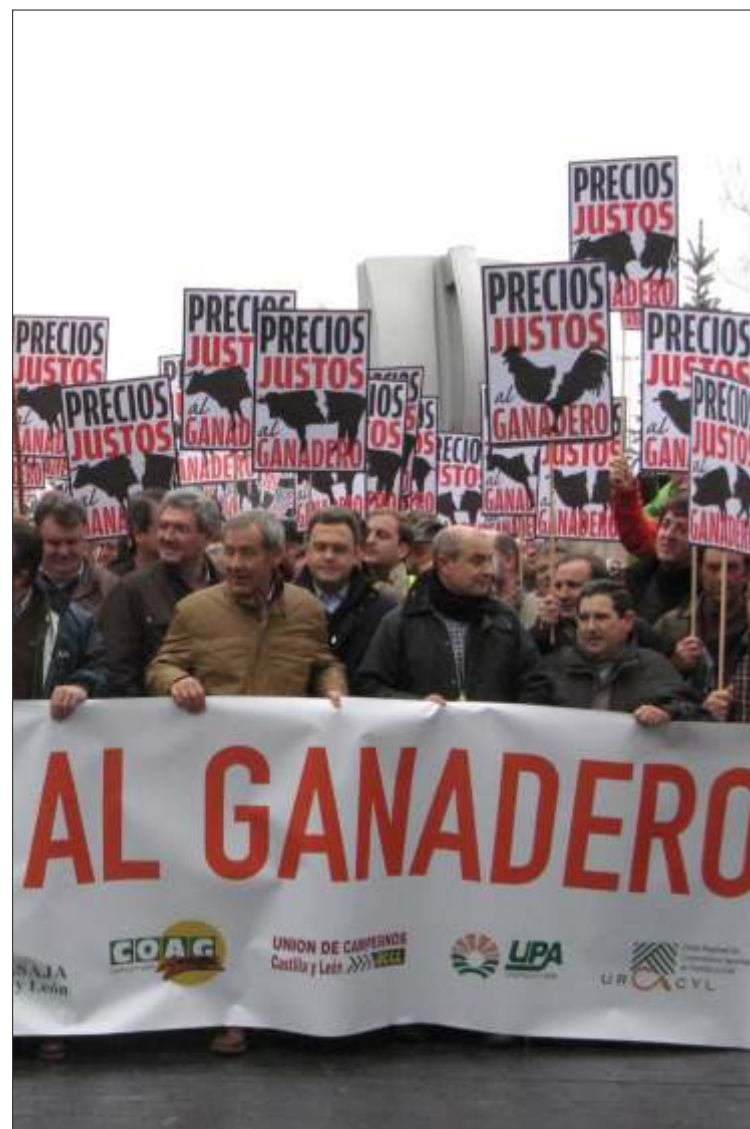
Cabecera de manifestación en Valladolid