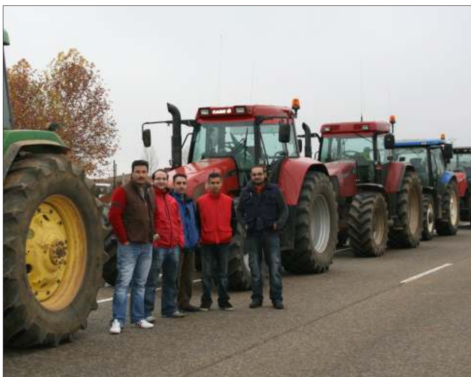
Concentración de tractores en Santa María del Páramo. En la foto, agricultores de Gordoncillo