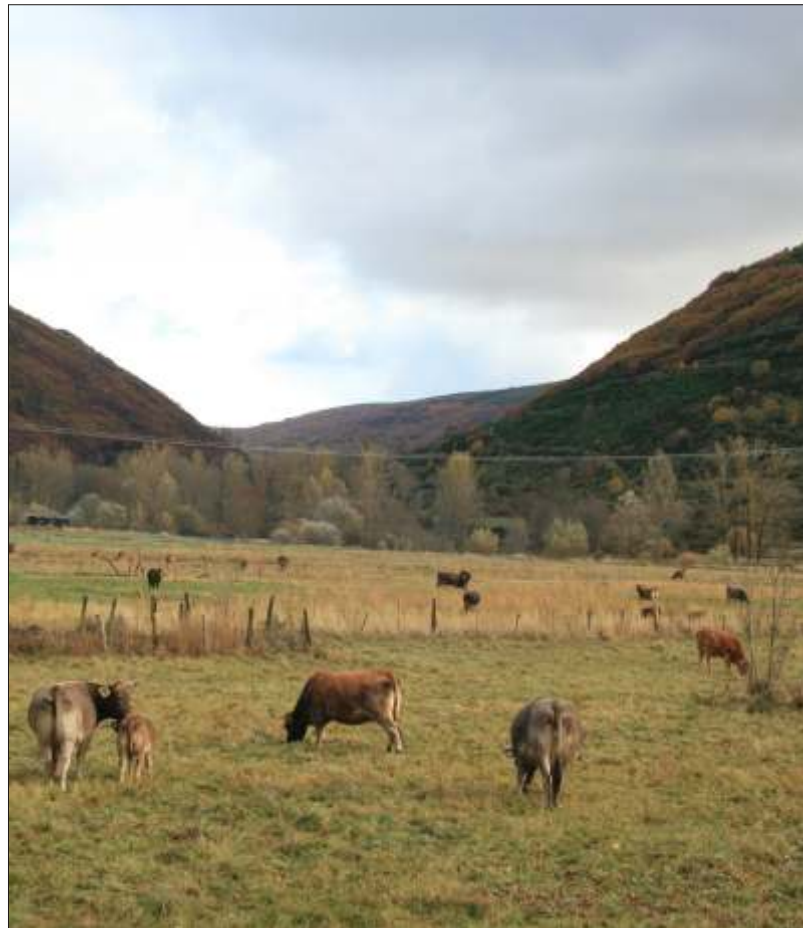
Vacas pastando en los prados de Omaña

ASAJA de León es la única organización de la provincia que está pidiendo que la nueva PAC contemple un incremento de los importes de los derechos de pago único para los ganaderos de las zonas de montaña y que está pidiendo fondos suficientes para ayudas agroambientales como son las destinadas al equino hispano bretón, o que tenga continuidad el programa de cese anticipado (jubilación anticipada) del que se han beneficiado mayoritariamente los ganaderos de montaña.