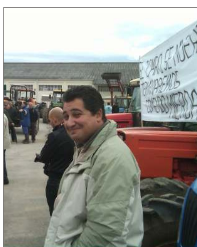
Concentración en Cacabelos