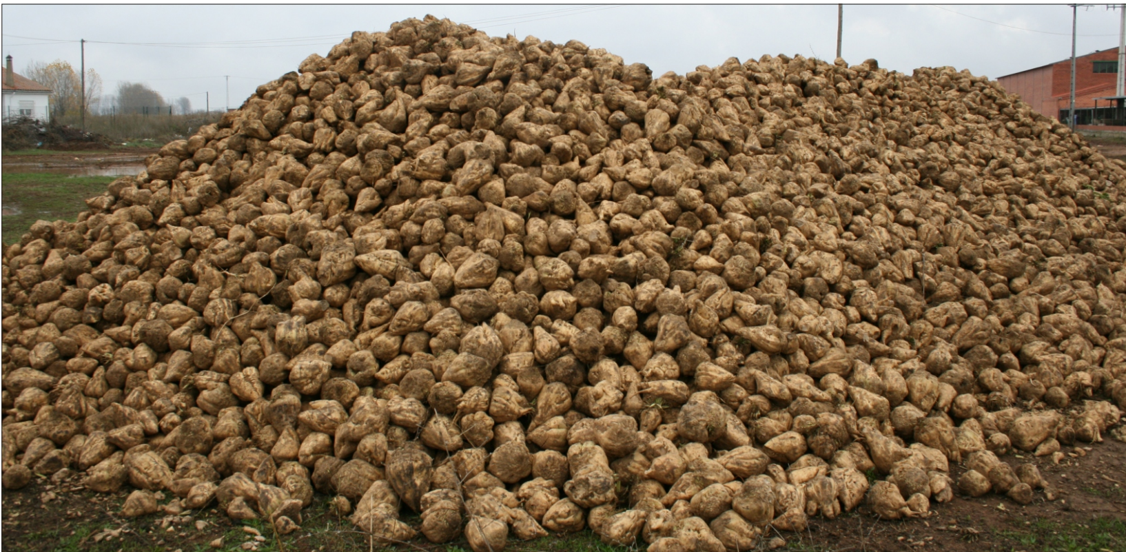
Remolacha en campo a la espera de enviar a la fábrica

ASAJA está reclamando a la industria azucarera precios más altos para que la siembra de remolacha sea atractiva para los cultivadores leoneses y ha hecho gestiones para que las entidades financieras anticipen, sin coste para el agricultor, las ayudas que llegan al sector y que suponen casi un 25% de todos los ingresos. ASAJA tiene un colectivo fuerte, de 160.000 toneladas y 300 cultivadores, gestionado con la máxima profesionalidad y dando el mejor servicio de los posibles a los integrantes del mismo.