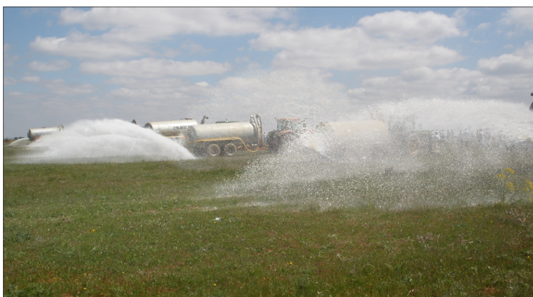
Cubas esparciendo leche en Toral de los Guzmanes