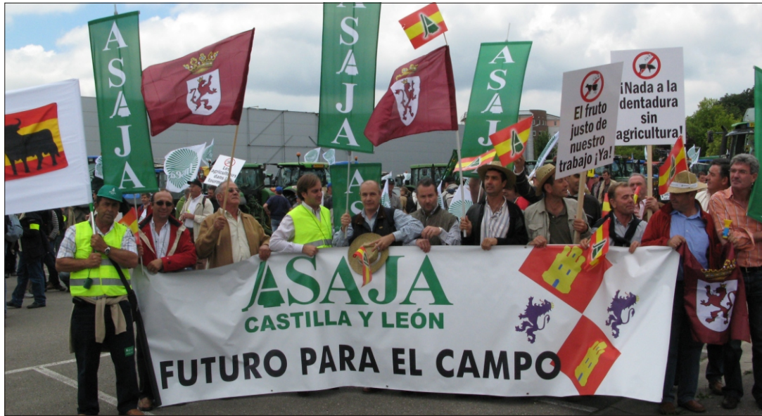
Manifestación en Luxemburgo, con presencia leonesa

Pero ASAJA, que reivindica en la calle, es una organización con vocación de llegar a acuerdos, de sentarse en las mesas de negociación, y por eso hemos estado en Bruselas visitando a los parlamentarios, hemos estado en instituciones propias como es el COPA-COGECA, hemos estado en la oficina de representación permanente de España ante la Unión Europea y hemos estado con altos funcionarios de la Comisión tanto con competencias agrarias como otras que nos afectan, y así nos entrevistamos en su día con el comisario Joaquín Almunia, responsable de las reglas de competencia.