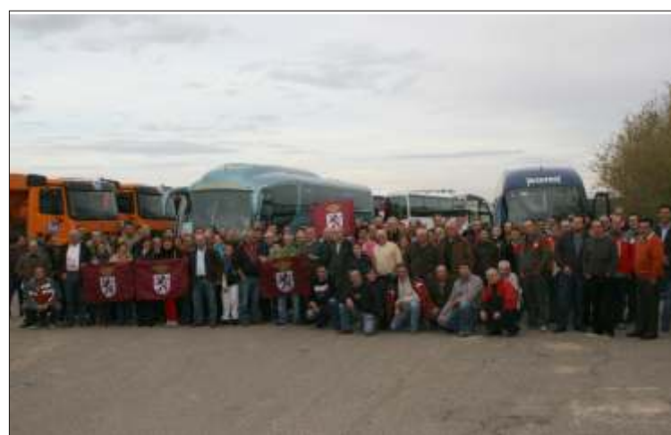
Autobuses de manifestantes leoneses dirigiéndose a Madrid