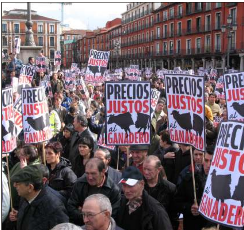
Manifestación de ganaderos por las calles de Valladolid

fuerzo de ASAJA no habría sido posible que muchas de las protestas se hayan llevado a cabo bajo el paraguas de la unidad de todos los sindicatos agrarios. Actos como los tres días consecutivos de protestas en León, Santamaría del Páramo y Madrid que celebramos de forma unitaria en