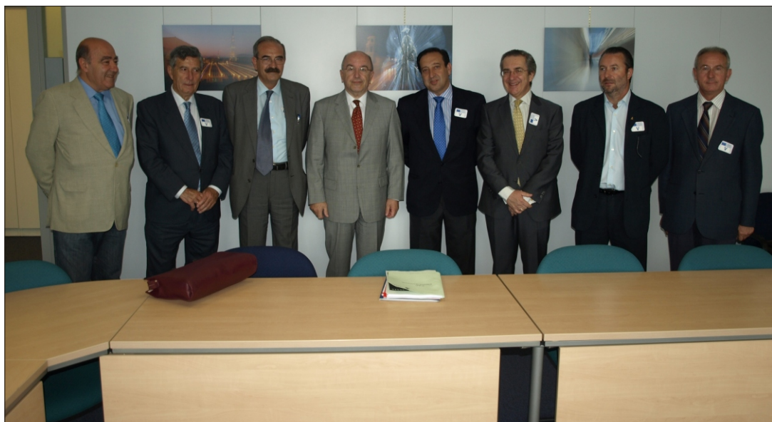
Reunión de ASAJA con el Comisario Joaquín Almunia