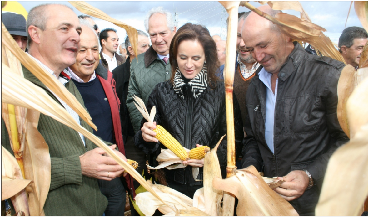
La consejera de Agricultura, Silvia Clemente, visitando explotaciones de maíz

En el otoño de 2011 ASAJA preparó un amplio documento sobre la situación del cultivo del maíz en León, principal provincia productora de España con unos 5.000 productores y entorno a las 65.000 hectáreas. El documento, además de ser una radiografía del sector, además de poner en valor el cultivo, es un documento reivindicativo en el que se exige a las administraciones públicas el debido apoyo para mejorar en rendimientos, reducir costes de producción, mejorar en la comercialización y adaptar las ayudas de la PAC a su realidad productiva.