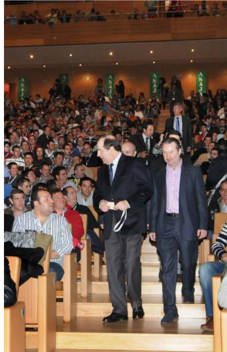
Juan Vicente Herrera en un acto con un millar de jóvenes organizado por ASAJA

ASAJA solicita para los jóvenes ayudas diferenciadas y específicas, acceso a la tierra y a los derechos de producción, reducciones fiscales, acceso al crédito, reducción en las cuotas a la Seguridad Social y programas de formación específicos. Estos apoyos tienen que ser todavía mayores para quienes se incorporan con ganadería y para quienes lo hacen en zonas más desfavorecidas.