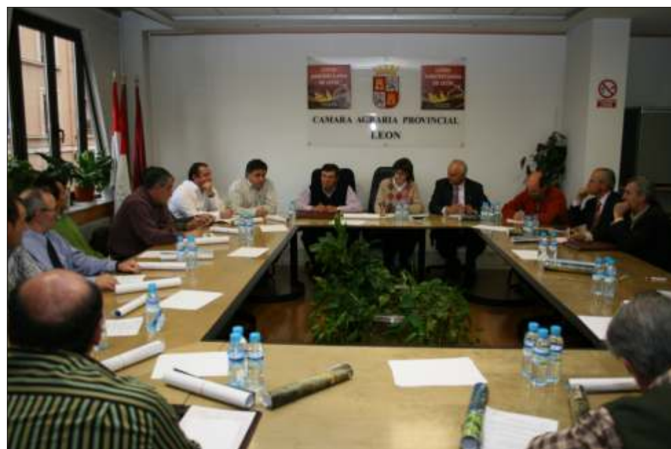
Sesión de la Lonja Agropecuaria en la sede de la Cámara Agraria

reponga a la Cámara un presupuesto suficiente y pueda seguir funcionando dando el servicio a las Juntas Agropecuarias, y seguirá gestionando la Cámara con el rigor con el que siempre lo ha hecho, sin malgastar un solo euro. Y en todo caso, si por decisión de la Junta la Cámara tuviera que cerrar sus puertas,