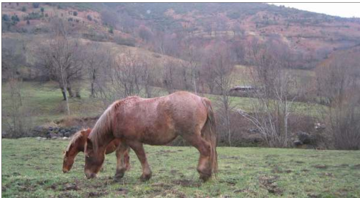
Caballo hispano bretón en los pastos de Omaña

dero ante las dudas de algunas pruebas, fondos para indemnización y reposición y sobre todo facilidad para mover animales de explotaciones positivas a cabañeros no calificados. Gracias a ASAJA la zona de Riaño está bajo un Plan Especial para la lucha contra la tuberculosis que trata de minimizar los efectos de esta enfermedad en las cabañas ganaderas.