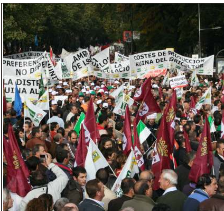
Multitudinaria manifestación en Madrid, con banderas leonesas de socios de ASAJA