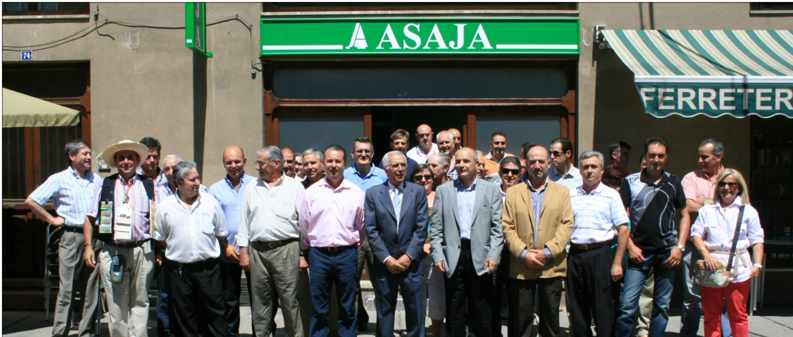
Acto inaugural de la oficina de Carrizo

ASAJA es la única organización agraria de la provincia de León que desde hace más veinte años viene apostando por dar un servicio de proximidad, cercano al agricultor y al ganadero, abriendo oficinas en las principales comarcas agrícolas de la provincia. Esto es facilitar las cosas a los agricultores y ganaderos que cada vez más necesitan las oficinas del sindicato agrario para informarse y gestionar los múltiples papeles a los que nos obligan nuestras relaciones con las administraciones públicas. A las oficinas de Sahagún y La Bañeza, que se abrieron en los primeros años de la organización, se sumó después la de Valencia de Don Juan, la de Ponferrada, la de Santa María del Páramo y recientemente la de Carrizo de la Ribera. Seis oficinas comarcales y una oficina provincial en la capital pensadas para atender a los socios y simpatizantes, pues son la casa de los agricultores, son su casa de confianza.