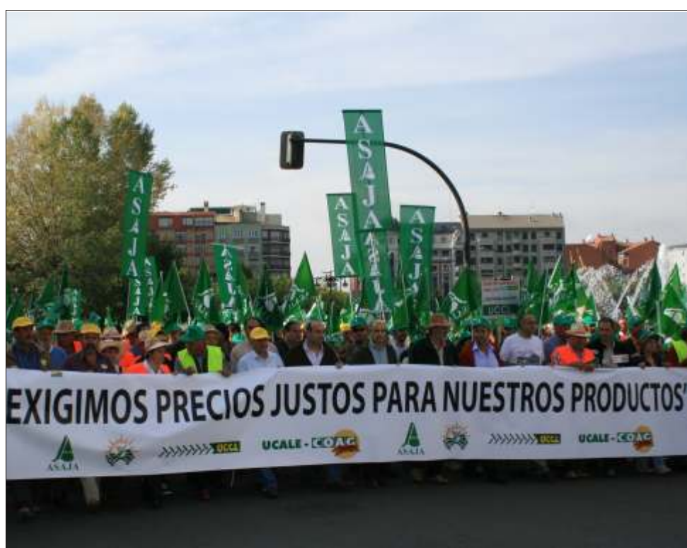
Manifestación conjunta por las calles de León

tos, renuncia siempre al protagonismo sindical que pudiera corresponderle, y lo único que le importa es ser eficaces para conseguir el objetivo que se propone: que se entiendan nuestras reivindicaciones y que las administraciones y la industria agroalimentaria escuchen y tomen medidas que nos favorezcan.