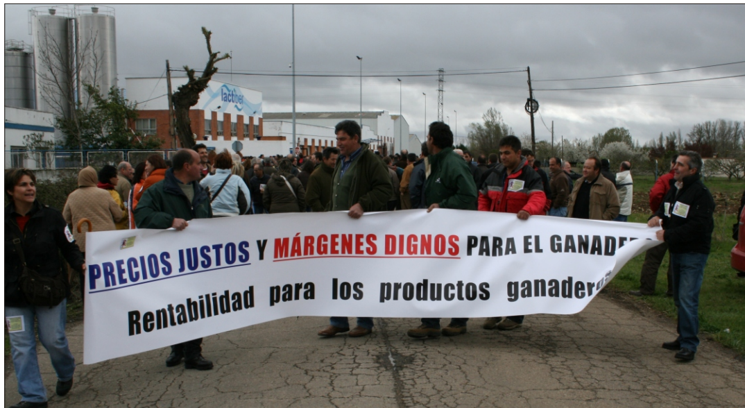
Manifestación frente a las instalaciones de Lactiber

Nos hemos encerrado en la sede de la patronal de las industrias lecheras en Madrid, hemos esparcido leche con las cubas en Toral, nos hemos manifestado a las puertas de muchas industrias lecheras, hemos recorrido las calles de Valladolid con nuestras pancartas, nos hemos plantado ante la Consejería y ante la Delegación del Gobierno, hemos estado en Madrid y en Bruselas con nuestras reivindicaciones, protestamos por las calles de León y alzamos la voz cuando en Babia y Omaña le quedaba a los ganaderos la leche sin recoger.