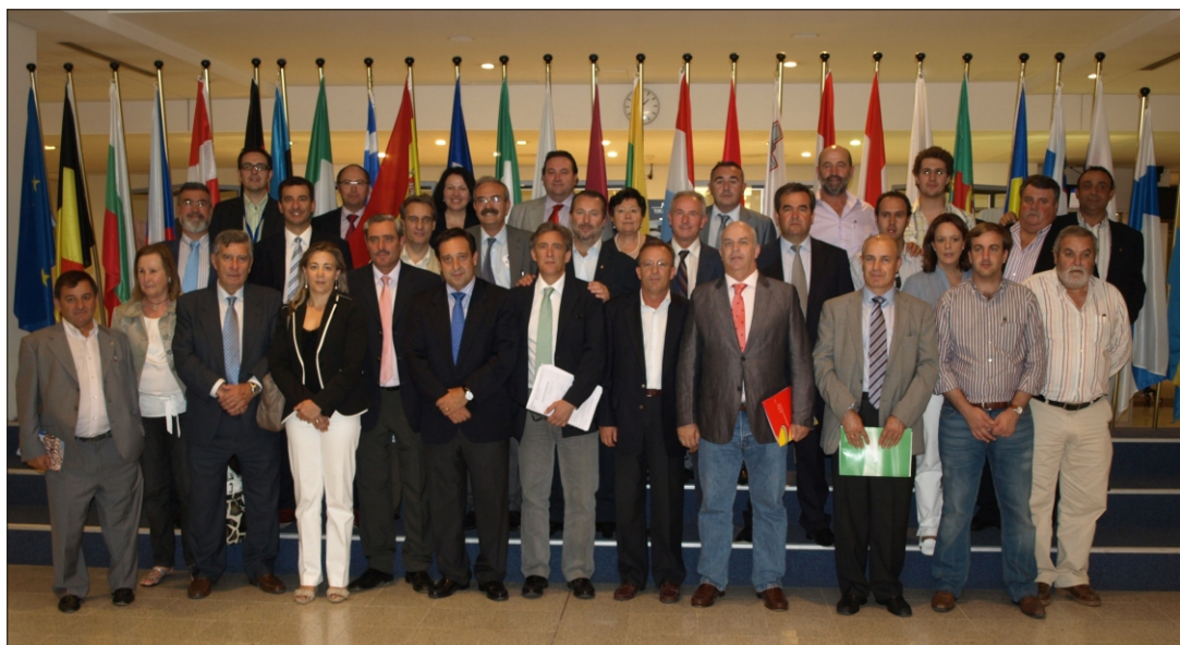
Reunión de dirigentes de ASAJA con parlamentarios europeos