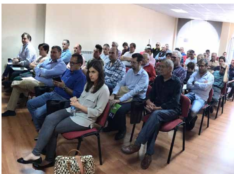
Saldaña y Aguilar acogieron las jornadas de ganadería.-