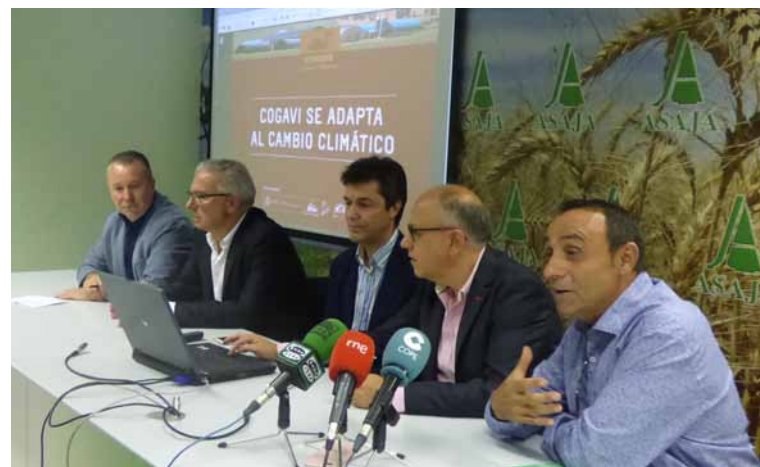
Los presidentes provincial y regional de ASAJA y el subdelegado del Gobierno acompañaron al responsable de Selectos de Castilla en la presentación.-

Por otra parte, se van a mejorar los consumos energéticos que en una explotación de estas