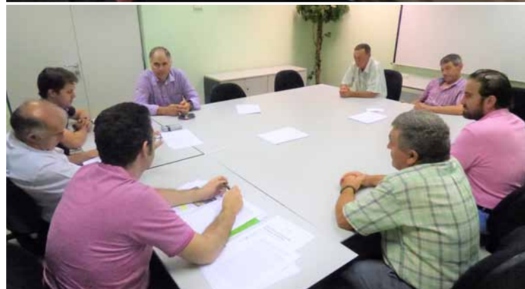
Miembros de las sectoriales de vacuno (arriba) y ovino.-