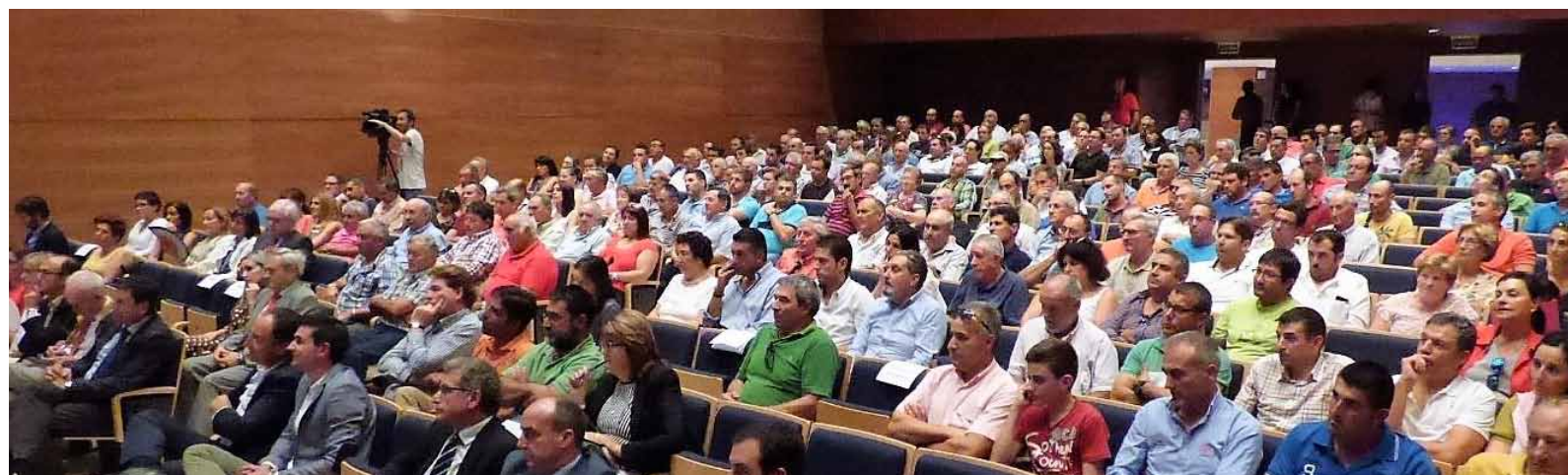
Público asistente a las jornadas.-

Según el ponente, el gran reto es intentar romper con la cada vez mayor distancia existente entre la actividad que desarrolla el sector primario y lo que la sociedad piensa que hace, es decir, entre el campo y la ciudad.