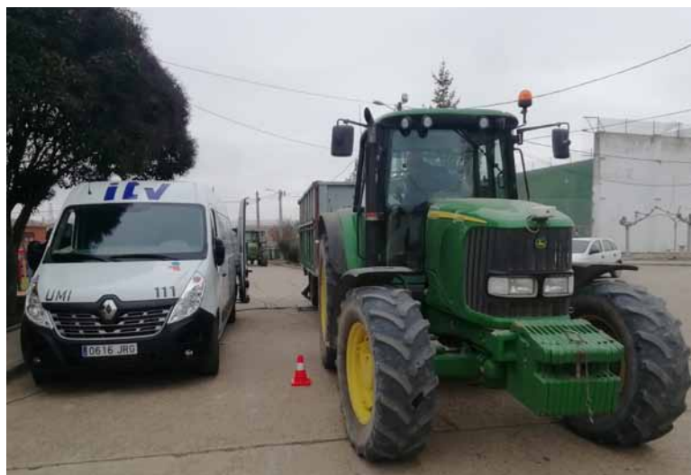
Un tractor en la unidad móvil de Itevelesa en Soto de Cerrato.-

senta la nueva normativa que regula la Inspección Técnica de Vehículos se refieren a la obligatoriedad de tener el seguro en vigor como condición previa a realizar la ITV y la exigencia de reparar los defectos calificados como leves en inspección en el plazo de dos meses. Además, se respeta la fecha del vencimiento anterior, si la inspección se realiza en los 30 días precedentes al plazo de expiración.