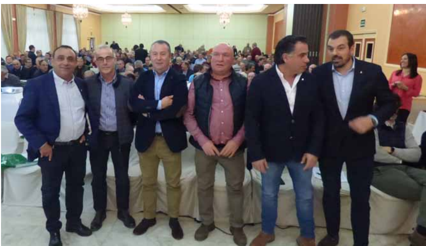
Los salones del hotel Europa Centro de Magaz acogieron la celebración de los actos de la Asamblea General, a la que asistieron cientos de afiliados.-