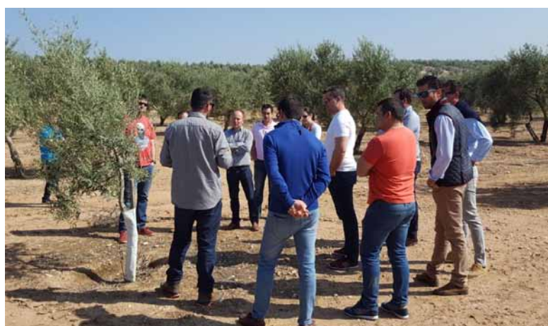
El grupo de Palencia durante su visita a un olivar.-

la retribución de las producciones agrarias en los mismos.