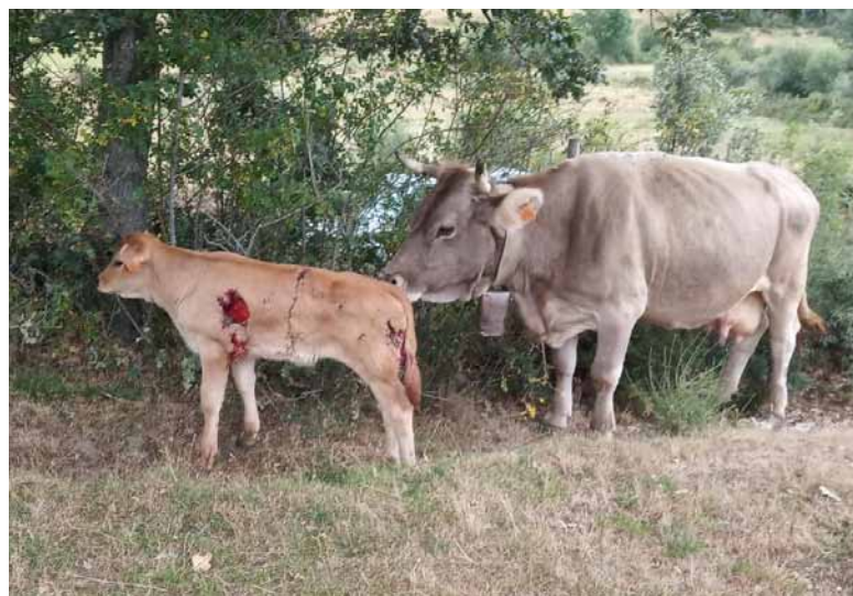
Cada tres días se produce un ataque de lobos al ganado en la provincia, mucho más de lo que puede soportar el sector. En la foto, el ternero atacado por el lobo.-

su elevado número hace imposible su convivencia con una ganadería que está en peligro de extinción, casi la única capaz de radicar población en el medio rural y generadora de riqueza y alimentos de calidad en la provincia. Todo ello sin olvidar la importante labor de limpieza de montes y desbroce que impide los incendios en aquellas zonas de alto valor paisajístico donde hay ganado.