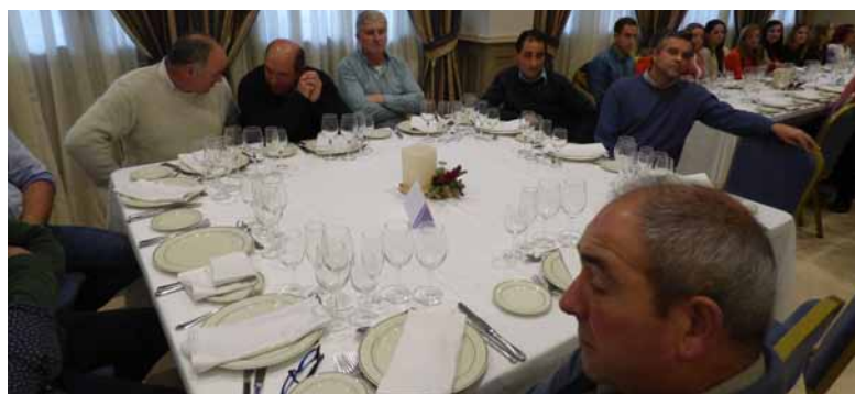
Sectoriales ganaderas y de forrajes de ASAJA Palencia durante la celebración del balance agrario anual.-