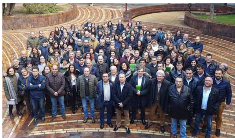
Foto de grupo de los asistentes a la convención.-