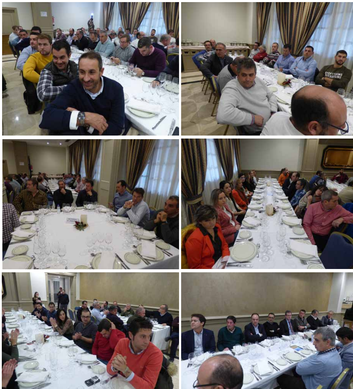
El balance agrario anual es todo un acontecimiento que reúne a los representantes de Asaja de Junta Provincial, comarcas, sectoriales, pero también a representantes de las instituciones, de cooperativas, empresarios, almacenistas, trabajadores de la organización y medios de comunicación.-

“ASAJA lo denunció en enero, pero se nos tildó de alarmistas, cuando el tiempo, tristemente, nos ha dado la razón»” dijo, y se preguntó por qué la administración no ha actuado antes en la limpieza de cunetas.