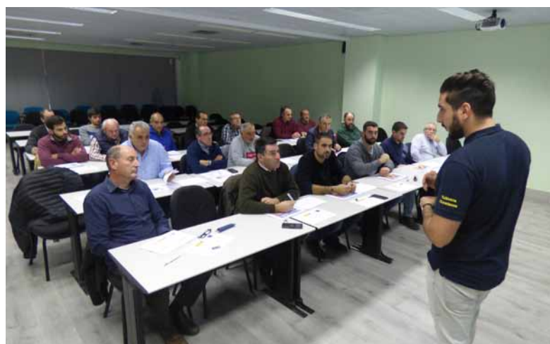
Arriba, el grupo de alumnos que ha completado el curso de incorporación. Debajo, curso de manejo de GPS.-