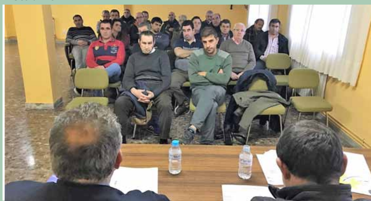
Becerril de Campos