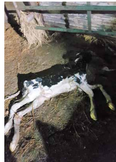
Un ternero murió por la riada que anegó una explotación de Nestar causando enormes daños.-

debería hacer CHD, multa constantemente y lejos de asumir sus responsabilidades las deriva e incumple con sus obligaciones”, denuncia ASAJA. “El despotismo define la línea de actuación de este organismo dependiente del Ministerio de Transición Ecológica, el más exigente con los administrados”.