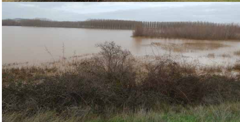
Imágenes de las riadas en las zonas de Soto y Hontoria.-

regular los ríos al máximo y aumentar la capacidad de agua embalsada de la provincia todo lo posible. Y todo ello sin dejar de hacer limpiezas periódicas e indemnizando a los damnificados por las crecidas.”