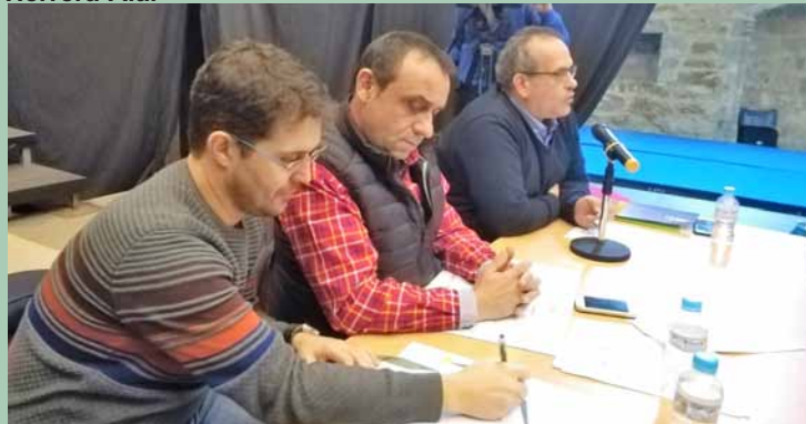
Presidente, gerente y el técnico de ASAJA en las asambleas.-

Un año más ASAJA PALENCIA ha reunido a sus afiliados a lo largo y ancho de la provincia, para informar, entre otros muchos asuntos, sobre las novedades de la PAC, la plaga de topillos, las ayudas a la sequía, la situación de la ganadería, los seguros agrarios, los cursos, las jornadas, la fiscalidad agraria... Las asambleas comarcales comenzaron el día 9 y finalizaron el día 20. A lo largo de todas estas jornadas, el presidente y el comité ejecutivo de la organización han recorrido todas las comarcas en unas reuniones que permiten compartir todo lo que tiene que ver con el campo y plantear las dudas que se generan en el día a día de la profesión. Para todos los participantes es una ocasión de departir y conocer de primera mano el pulso de la actualidad agrícola y ganadera de una forma cercana en este tradicional ciclo de ASAJA.-