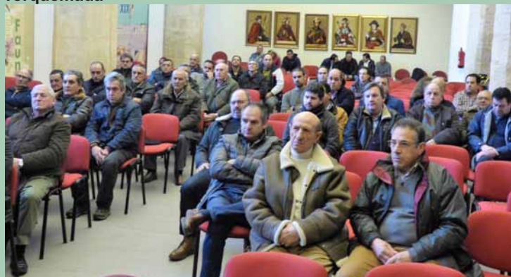
Paredes de Nava