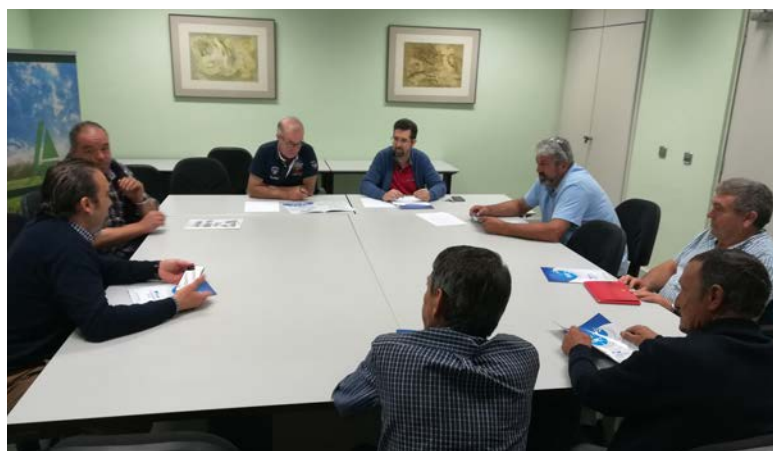
Representantes de la Sectorial de Ovino de Asaja Palencia.-

Desde ASAJA, se ha solicitado a la Consejería que se potencie la salida del producto al único canal que ahora está abierto, el de la distribución, ampliando la oferta de lechazos y otros cortes de cordero interesantes para los consumidores. “Es justo en esta época cuando