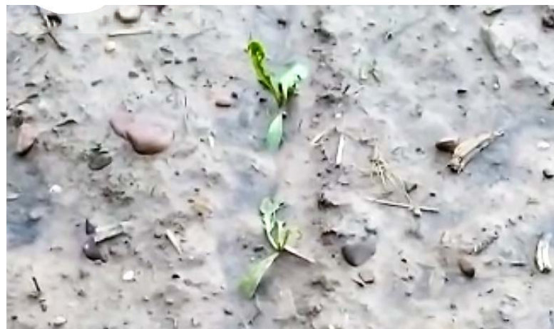
Daños de pedrisco en la zona de Carrión en el cultivo de remolacha.-