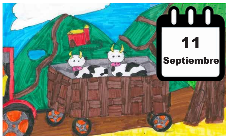
Uno de los dibujos premiados en anteriores ediciones.-

Así, se convoca el concurso de pintura "Así es mi pueblo" para niños de hasta 12 años, que este año cumple su XXII edición. Con este certamen se pretende que los pequeños muestren sobre el papel el día a día de los pueblos y campos de Castilla y León, dibujando motivos agrarios y ganaderos, paisajes, personas o cualquier otro aspecto de la vida rural.