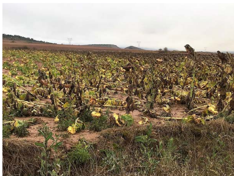
Daños de girasol en la zona de Aguilar.-

Hace sólo unos días Asaja Palencia recordaba la importancia de asegurar los cultivos para evitar pérdidas de renta ante las consecuencias del cambio