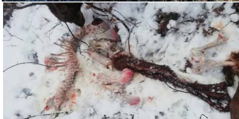
Tres terneros de pocos días muertos por los buitres en otros tantos ataques en el plazo de mes y medio. Las carroñeras atacan a los animales vivos (arriba). En un caso, sólo dejaron los huesos (foto inferior)

a través del canal de restauración, se suma ahora este problema.