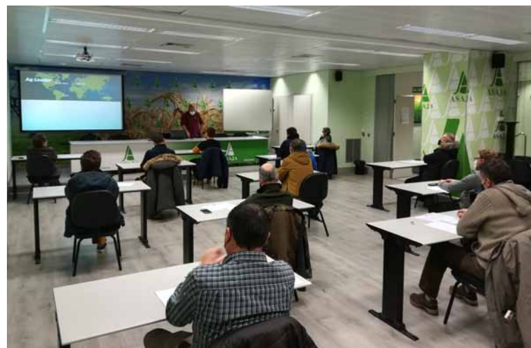
Alumnos de uno de los cursos de manejo de GPS que se celebran en ASAJA.-

Todos los cursos están cofinanciados por la UE a través del Feader