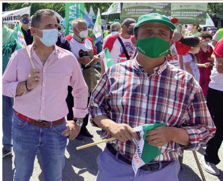
El presidente de ASAJA Palencia participó en la protesta.-

ASAJA y el resto de organizaciones convocantes de la concentración mantienen las espaldas en alto, a la espera de que el Ministerio se comprometa a renegociar el tema y procurar una solución consensuada con el sector ganadero y con las comunidades autónomas afectadas por el lobo, “una solución que necesariamente debe establecer mecanismos de gestión y control de las poblaciones”.