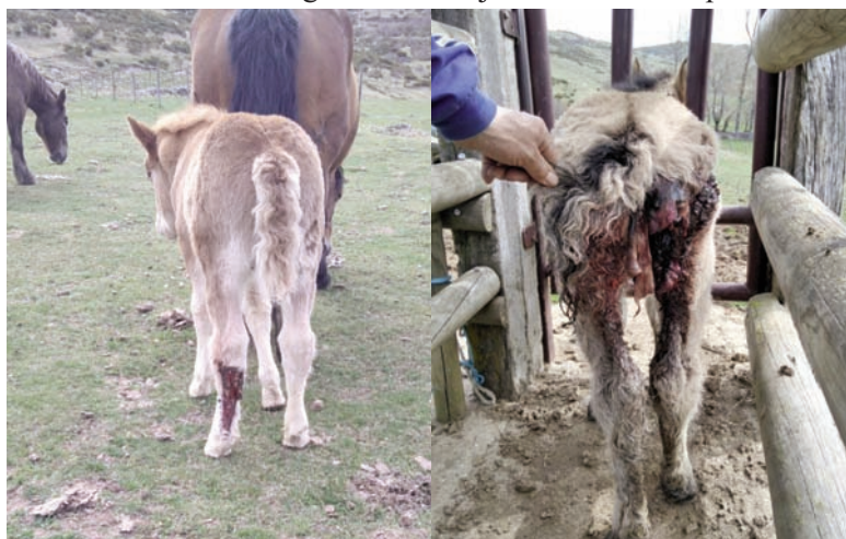
Así quedaron estos potros tras el ataque del lobo en La Lastra. ¿Cómo puede a alguien gustarle que esto ocurra?

En la provincia de Palencia actualmente miramos de reojo a la provincia de Ávila, que sufre más de mil ataques al año y que, por estar situada al sur del Duero, no ha contado con el control poblacional cinegético que sí hemos tenido en nuestra provincia -hay que recordar que de los cupos de lobo que se permitían sólo se cazaban algo más de la mitad, por lo elevado de su coste y por lo difícil de cazar un animal tan astuto. Ávila marca un camino que no queremos seguir.