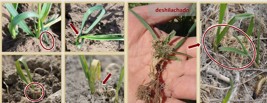
Sintomatología típica: hojas dobladas con las puntas introducidas en las galerías y deshilachado