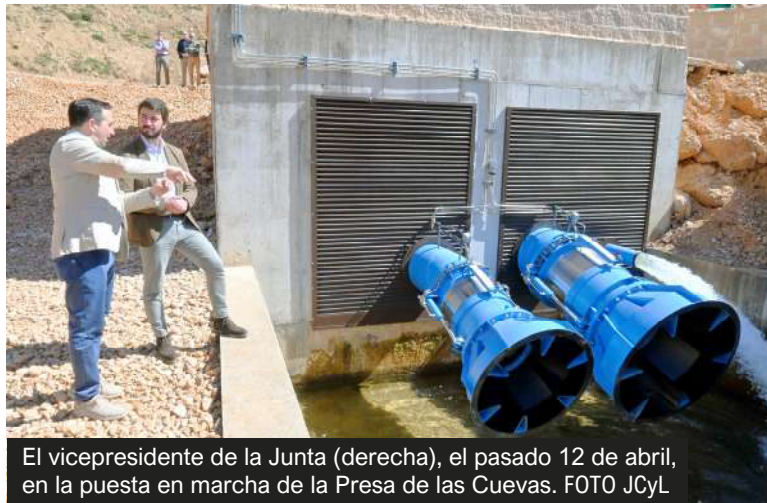
El vicepresidente de la Junta (derecha), el pasado 12 de abril, en la puesta en marcha de la Presa de las Cuevas.