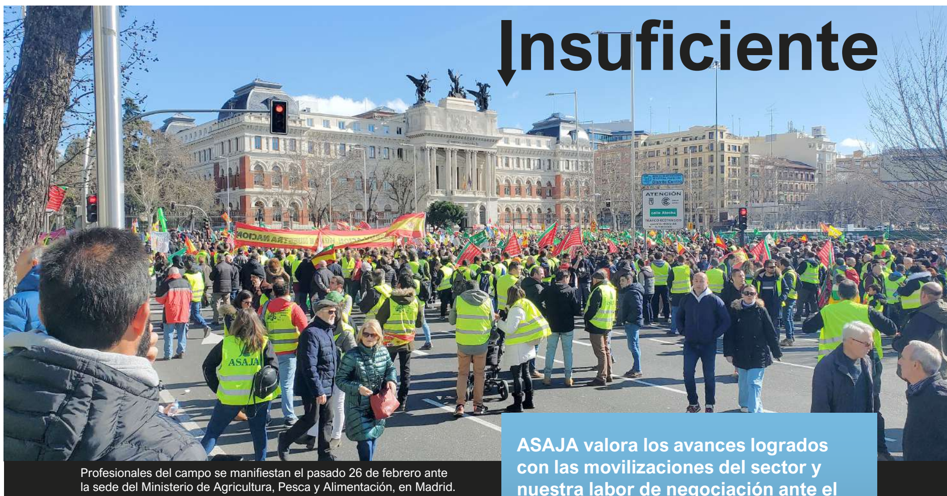
Profesionales del campo se manifiestan el pasado 26 de febrero ante la sede del Ministerio de Agricultura, Pesca y Alimentación, en Madrid.

Puedes seguirnos en X y en Facebook @asajapalencia