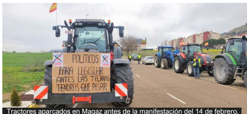
Tractores aparcados en Magaz antes de la manifestación del 14 de febrero.

La flexibilización de algunos requisitos de los ecorregímenes responde a una lógica agronómica y a la necesidad de adaptar dichos requisitos a la realidad climática y productiva de las explotaciones, necesaria