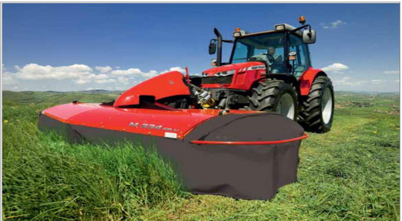
Las segadoras de Massey Ferguson, una solución fiable y económica para la cosecha de forraje de alta calidad.

Todas estas máquinas comprenden la nueva línea de producto que Massey Ferguson tiene disponible para el tratamiento y recolección del forraje. No obstante, puede pedir más información de estas máquinas en el concesionario de Massey Ferguson Agroduero.