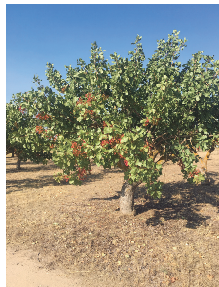
Plantación de pistachos.

son claves para tener éxito”, sentenció.