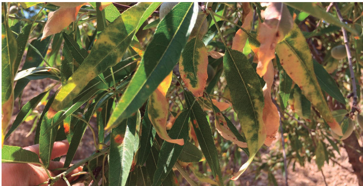
Árbol afectado por Xylella en la península ibérica.

Aumenta la preocupación en la provincia de Salamanca por la cercanía de la detección de un olivo afectado de Xylella en la Comunidad de Madrid, caso confirmado por el Ministerio de Agricultura y la Consejería madrileña; lo que desmontaría la teoría de que la bacteria no prolifera en climas fríos. Se insiste en extremar las medidas fitosanitarias en viveros y que se contemplen las indemnizaciones.