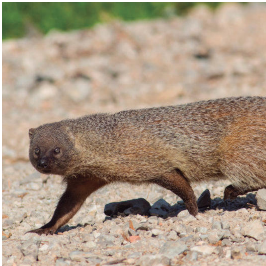
Ejemplo de meloncillo, que ataca en manada al ganado.

La organización agraria ASAJA Salamanca insistió en el Consejo Territorial de Caza que se fortalezcan los controles sobre determinadas especies transmisoras de enfermedades y se permita controlar otras no cinegéticas como el meloncillo, también que se abra la veda en más términos municipales por la plaga de conejos