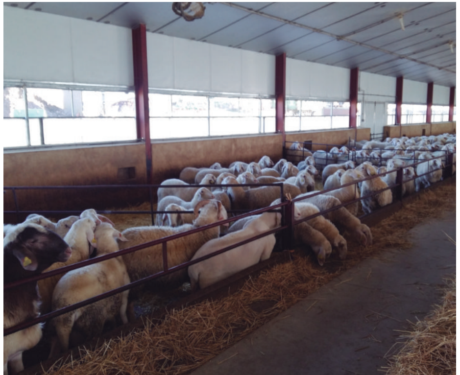
Explotación salmantina de ovino de leche.

Se paga por litro de leche de oveja la friolera de 72 céntimos