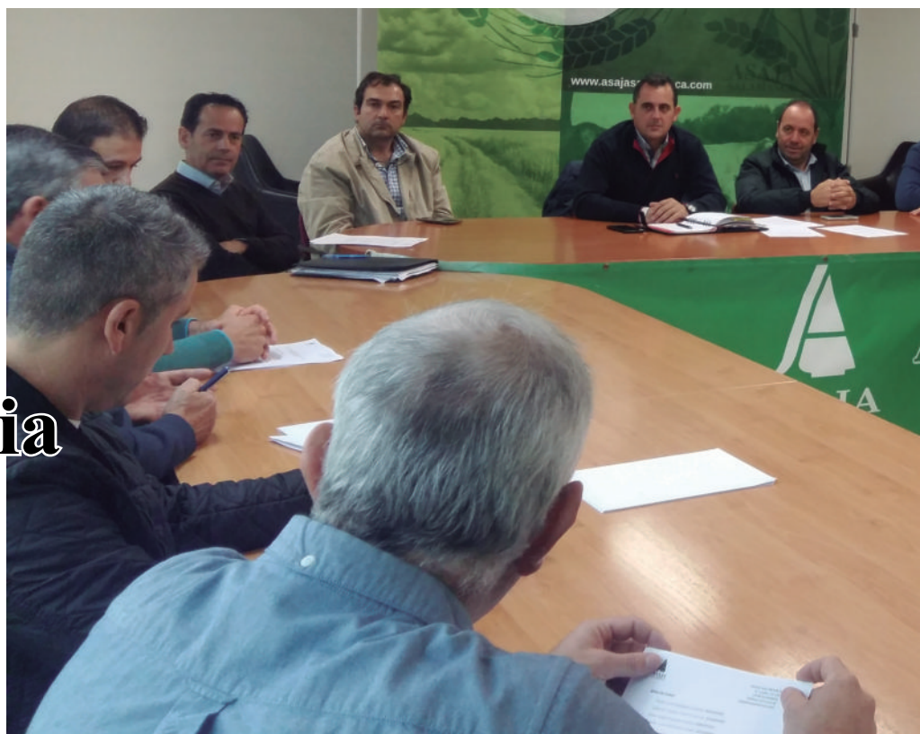
Reunión de los vocales en la sede de ASAJA Salamanca a mediados de noviembre.

El 26 de noviembre se estrenan los nuevos representantes en las diferentes mesas de cotizaciones