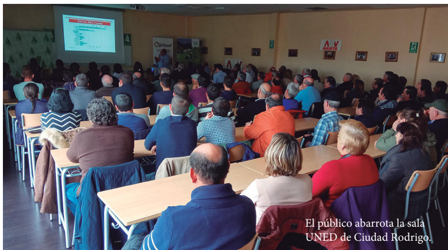
El público abarrotó la sala UNED de Ciudad Rodrigo.