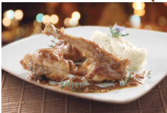
Conejo guisado 'Alegre Navidad'