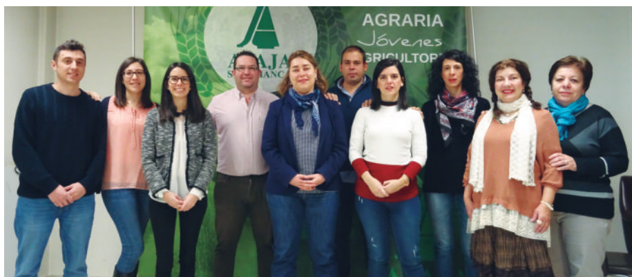
Técnicos de la organización, parte del equipo de ASAJA Salamanca.

Aquellos que trabajan todos los días por nuestro bien y que, además, son expertos en las cuestiones de tramitación de la Solicitud Única son tus técnicos de confianza, los de ASAJA Salamanca. Este año, los convenios con entidades bancarias son: Santander (Banesto y Popular), Caixa Bank, BBVA, Sabadell (con autorización) y Unicaja (para éste último se debe aportar el número actualizado de la cuenta, ya que el de Caja España Duero queda extinto).