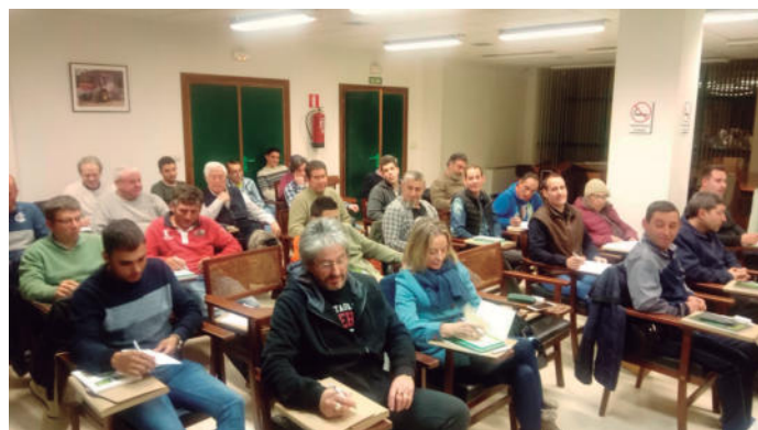
Curso de Manipulador de productos fitosanitarios, celebrado del 6 al 13 de marzo de 2019.

Todas las personas interesadas pueden inscribirse llamando al 923 190 720.