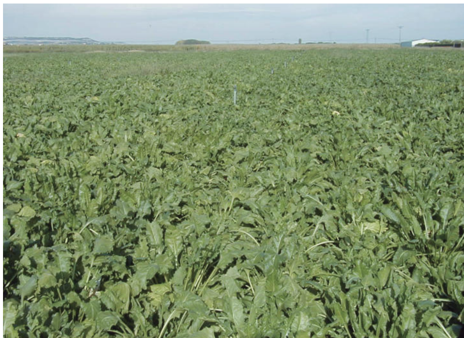
Una explotación de remolacha.

Se alarga, hasta 2021, la vigencia de cerca de 10.000 los contratos suscritos en 2015 por agricultores y ganaderos de Castilla y León; tal y como ASAJA ha solicitado reiteradamente a la Administración