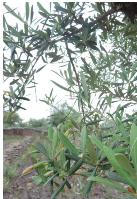
Una explotación de olivos, como cultivo en paisaje singular, de la provincia salmantina.